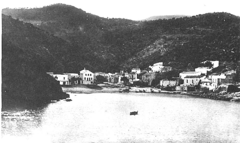
Sa Tuna, vista per Fagnoli, és una imatge típica de la Costa Brava d'abans del turisme.