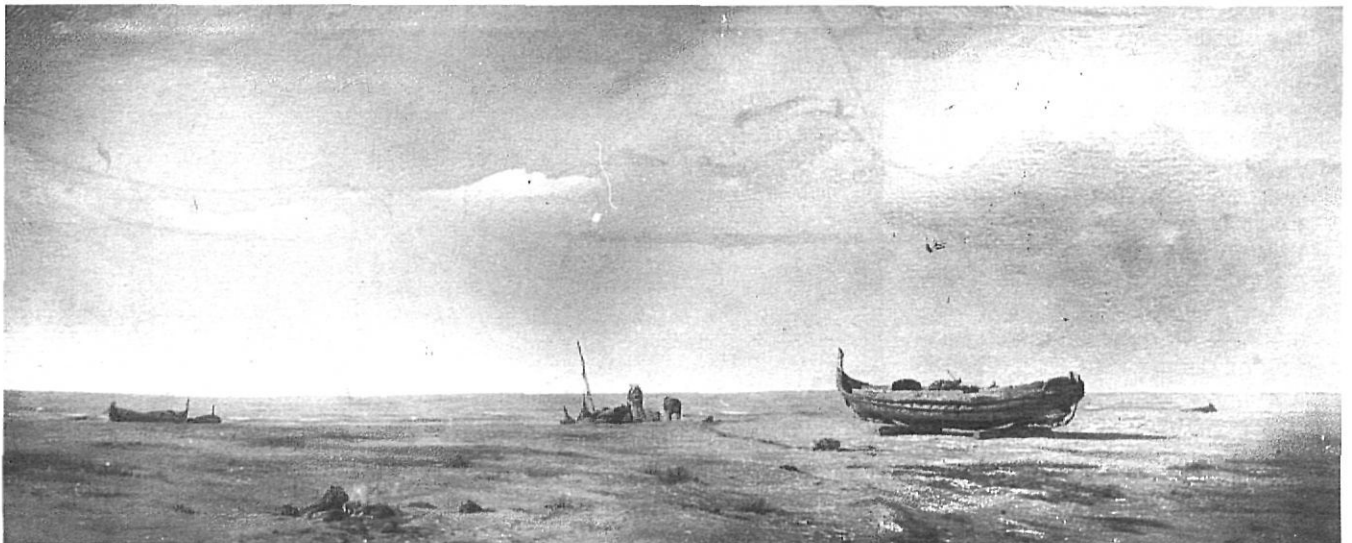
«Platja de la Rabassada», oli sobre tela (148 × 58,7 cms.).

nito negruzco, más ennegrecido aún por la acción de los siglos, unas puertas que se desvencijan, unas ventanas que se caen, unos óleos de tejado de tejas rotas y los maderos carcomidos, he aquí sus primeros términos; un fondo lejano, de tonos más claros, con efectos de sol, de niebla, de crepúsculo o de noche, tal cual figurita abocetada, pero todo original, atrevido, singular, nuevo, revelando una gran iniciativa en el pintor y una decisión irrevocable de no seguir las huellas de nadie, tales son los cuadros de Urgell, acerca de los cuales tendrá la crítica materia para muchos y muy diversos