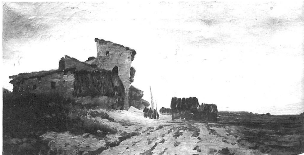
«Processó de poble», pintura a l'oli.