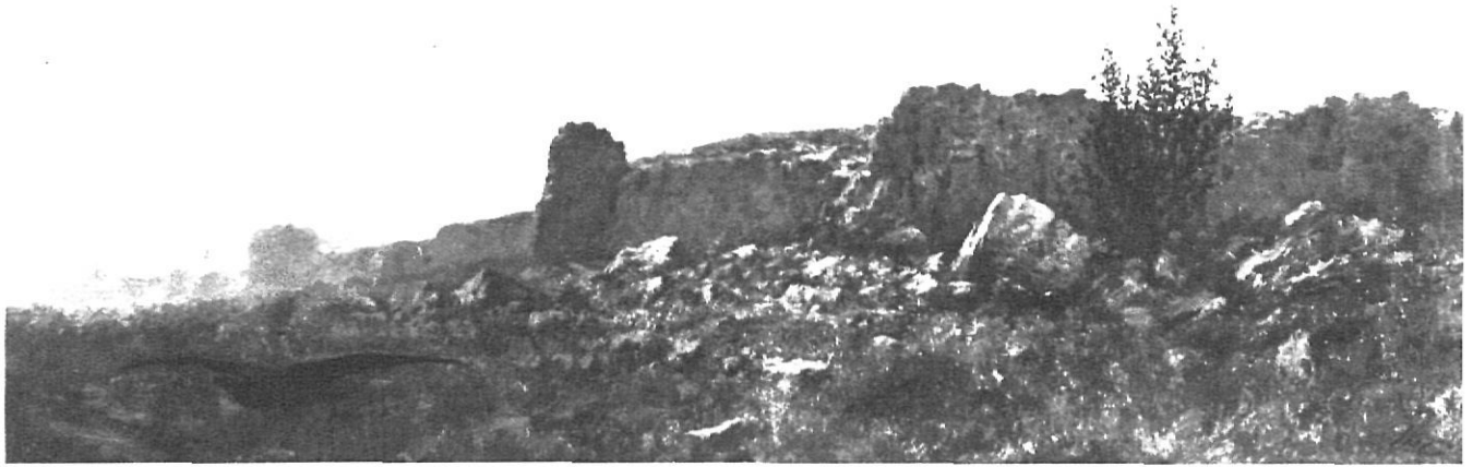
«Montjuïc», pintura a l'oli (67,7 × 116,5 cms.).

pies, amb una temàtica molt particular i molt difícil d'encasellar dins els corrents artístics del moment, un artista amb un estil i una forma de pintar molt propis.