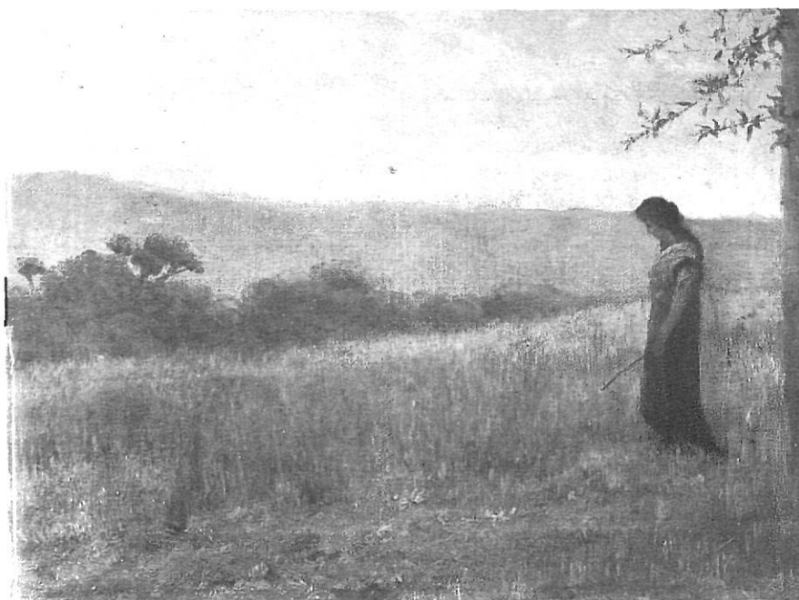
«Paisatge amb figura», pintura a l'oli (36 × 55,7 cms.).

escritos. Por nuestra parte no podríamos negarle en justicia que entiende como nadie los más opuestos artificios de la luz que busca las dificultades por el gusto de vencerlas, que sabe valerse de los contrastes y que logra casi siempre impresionar de una manera profunda 1 .