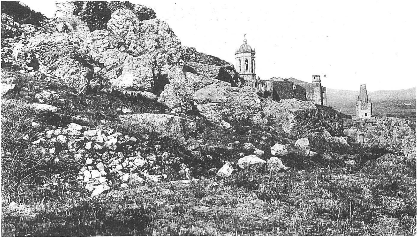
El castell de Gironella, després de defensar la ciutat de Girona, en nombrosos setges que van del segle XI fins al XVIII, fou destruït per ordre de Napoleó, l'any 1810.