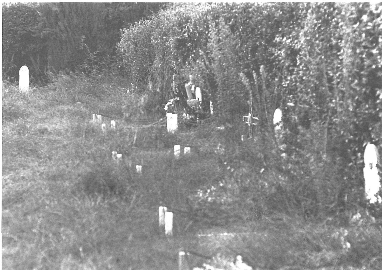
Totes les fotografies que il·lustren aquest treball corresponen a l'estat general i a aspectes particulars en què es trobaven en el cementiri municipal de Girona, fins l'any 1979, les tombes dels gironins afusellats pel règim franquista en els anys quaranta.