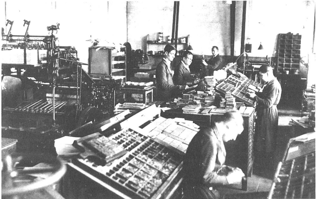
Després de l'ocupació de Girona, el material que pertanyia a la impremta de «L'Autonomista» va ser incautat.

coses. El 16 d'abril de 1941, emparant-se en l'ordre del ministeri de l'Interior del 10 d'agost de 1938 i la llei del 13 de juliol de 1940, per la qual es disposava que les imprentes «recuperades» formessin part del