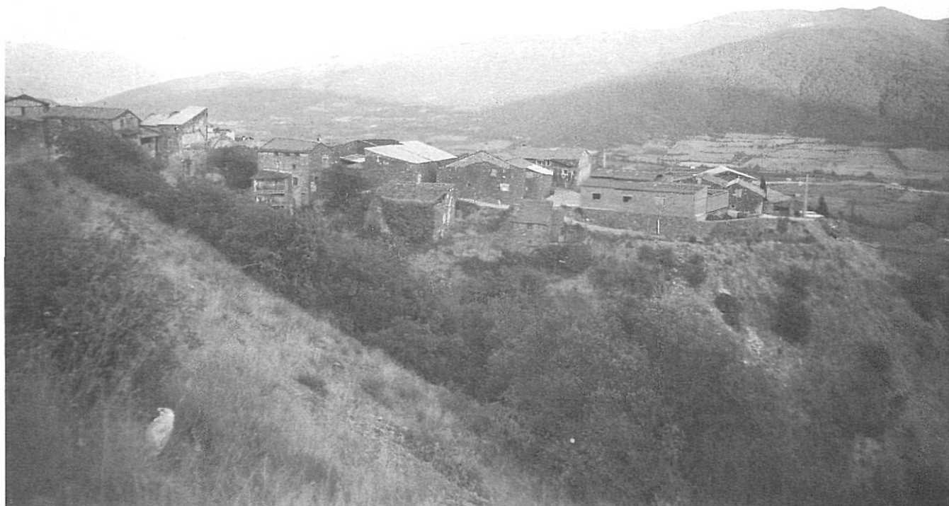
Panoràmica d'Hortó. Juntament amb la Cerdanya, l'Alt Urgell, l'Alta Ribagorça, el Pallars Jussà o el Pallars Sobirà també pateixen l'oblit i les bosses de pobresa que afecte l'Alt Pirineu, una "terra sense pa".