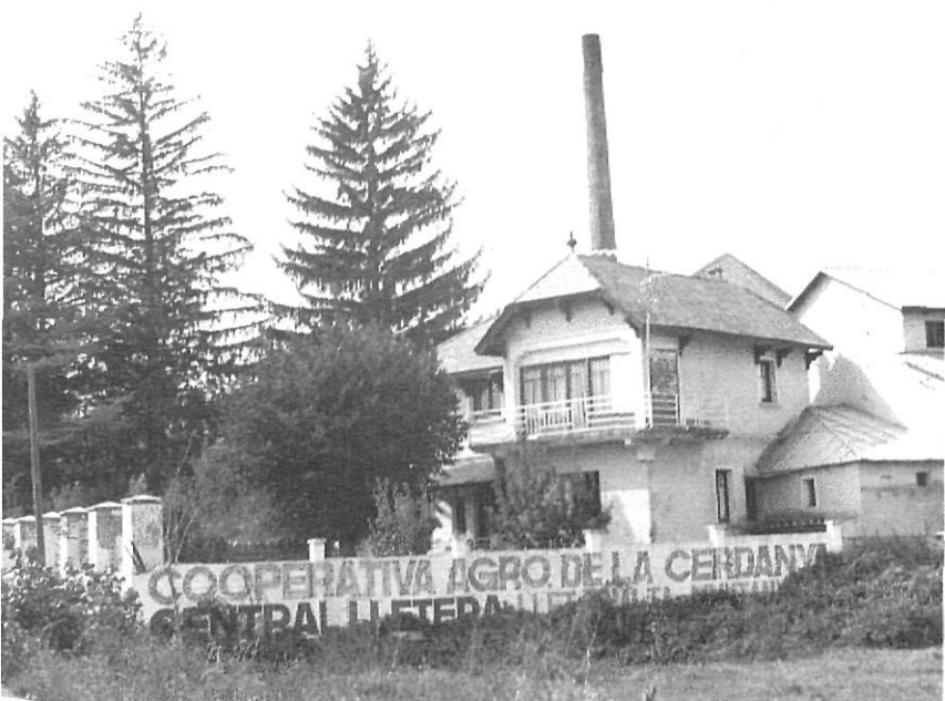
Una Cooperativa de la Cerdanya. El sistema cooperatiu encara és molt inusual a les comarques catalanes de muntanya.