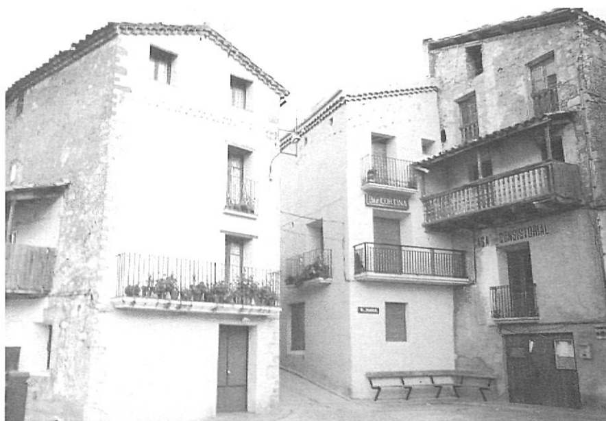
Tuixen és una illa de prosperitat, mercès als neo-rurals i a la neu.