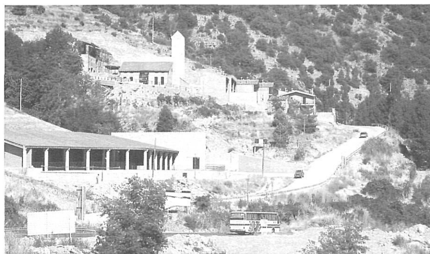
El nou Pont de Bar, construït per la Generalitat, mostra descaradament el seu ciment i noves formes a un món rural que no entén gaire com es menja un disseny com aquest a l'alta muntanya.

centenària, una cultura oral de llegendes i cançons, una particular arquitectura, tot allò que permetia a l'home integrar-se i viure en un medi hostil com l'Alt Pirineu i que avui, enmig de l'afany especulatiu d'uns i la indiferència dels altres, està morint sota l'embranchida de l'uniformisme cultural. Igual que en altres pobles de la Cerdanya, els pagesos d'Urtx estan convençuts que les seves explotacions estan condemnades a desaparèixer i que amb elles es perderan camps i conreus i que el bosc, trencat l'equilibri natural, anirà guanyant terreny fins a convertir el Pirineu en un autèntic desert, esquitxat per oasis poblats.