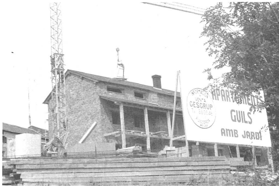
Apartaments en construcció a Guils de Cerdanya.