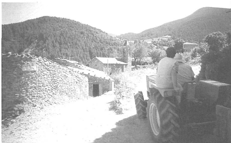
Un aspecte del poble de Nevà, situat a pocs quilòmetres del turístic Planoles.