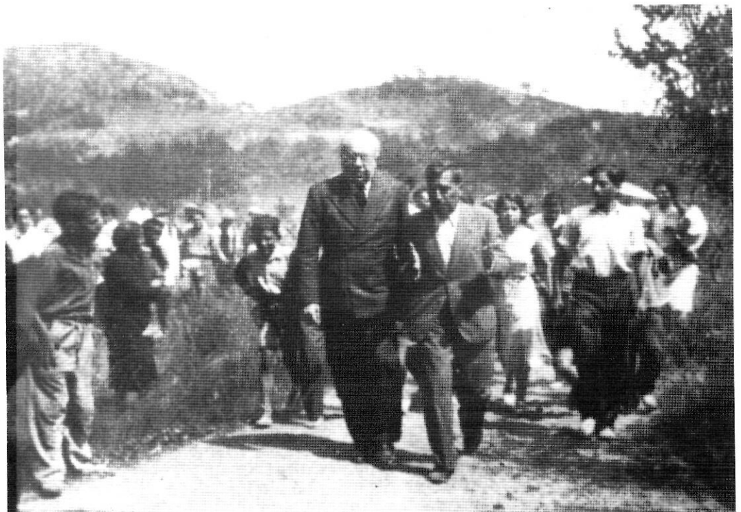
Durant els anys de la República, Santaló va viure intensament la política. A la fotografia acompanya Manuel Azaña en una visita a Tossa de Mar.

Enfront de visions tradicionals, la Geografia contemporània, al final del segle XIX i principi del XX, subratllava la validesa d'unes divisions «naturals» —fonamentalment de base física, volen dir—. Enfront d'altres artificioses divisions —per exemple i especialment, les polítiques i administratives—, les regions i les comarques naturals mostren clarament que corresponen a unes autèntiques realitats i es dibuixen com ben dignes d'ànalisi. El «diàleg» entre natura i home, podríem dir, s'estableix a través d'aquestes unitats geogràfiques. Seran, en definitiva, les peces claus en l'estudi del geògraf i que representaran l'etapa de culminació de la seva formació com investigador. No entrem ara en un debat sobre l'exacta significació d'aquest concepte i d'aquestes aplicacions, que hem fet ja en altres ocasions (Vilà Valentí, 1983, 1988 b, especialment).