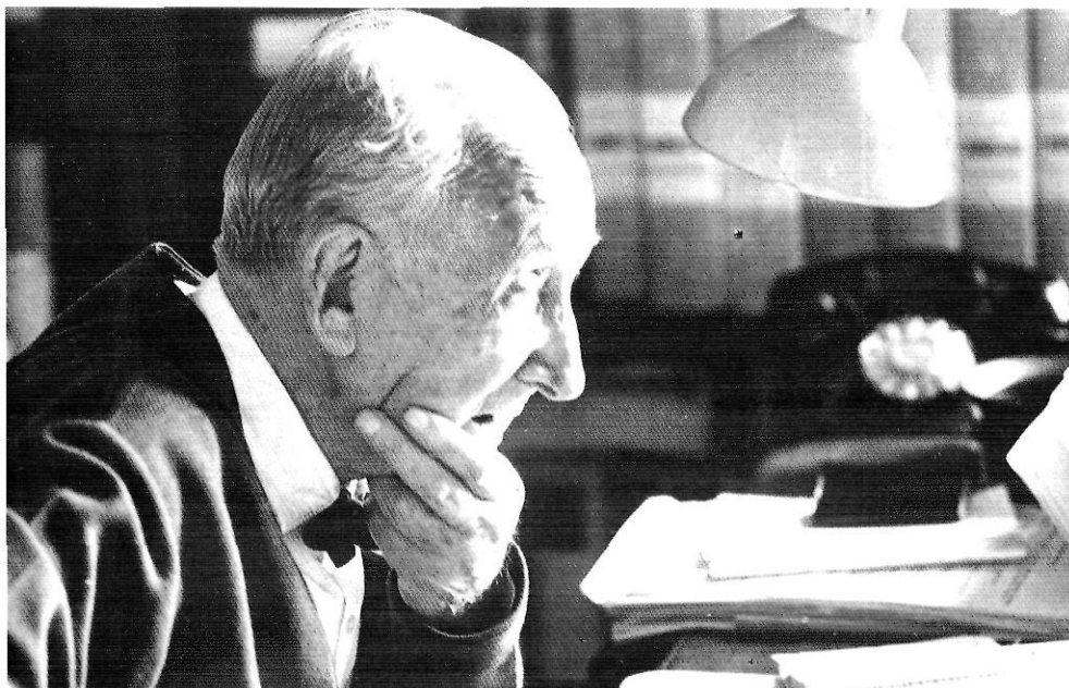
Al començ del tercer decenni es produí també la «conversió» de Pau Vila cap a la Geografia.