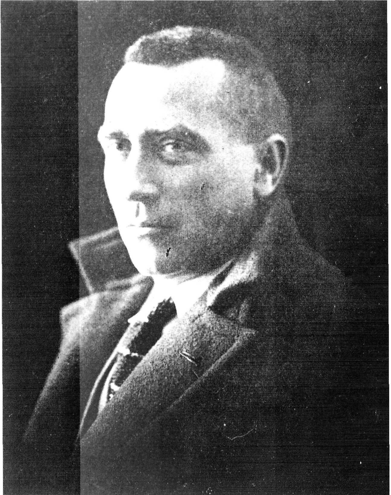
Miquel Santaló geògraf, pedagog i polític