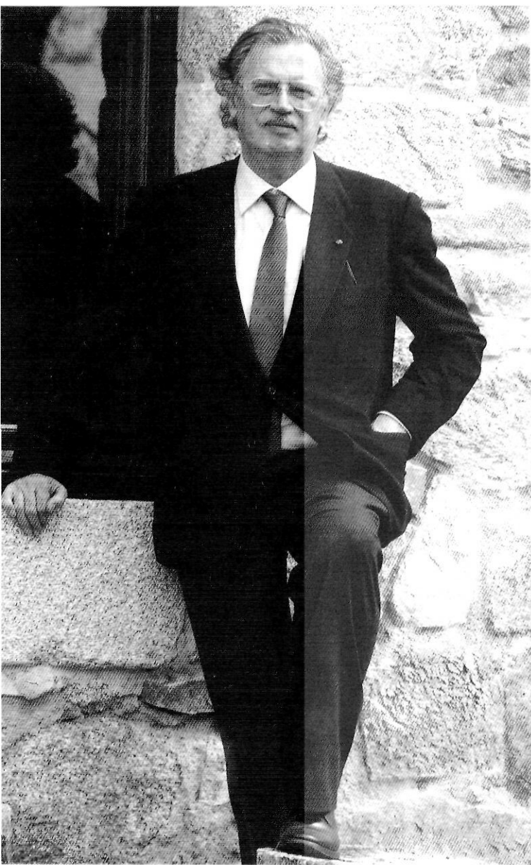
"Hem arreglat la casa de Santa Cristina pedra per pedra".

J o sóc un barceloní que viu a la Rambla de Catalunya. A la mateixa casa en què va néixer. He fet bastant anys de refugiat polític juvenil a Amèrica del Sud, on he après dues coses: una, a con- viure amb la natura poderosa i exuberant del nou continent; l'altra, a comprendre que el més impor- tant és poder viure en llibertat a la pròpia pàtria. L'expressió catalana de la natura, si bé una mica en la línia d'una delicada i meravellosa miniatura, els catalans la tenim bé. Poder gaudir de la llibertat dels homes i dels pobles al mateix temps que fruit de la nostra terra ja és més complicat, com molts de nos- altres hem experimentat.