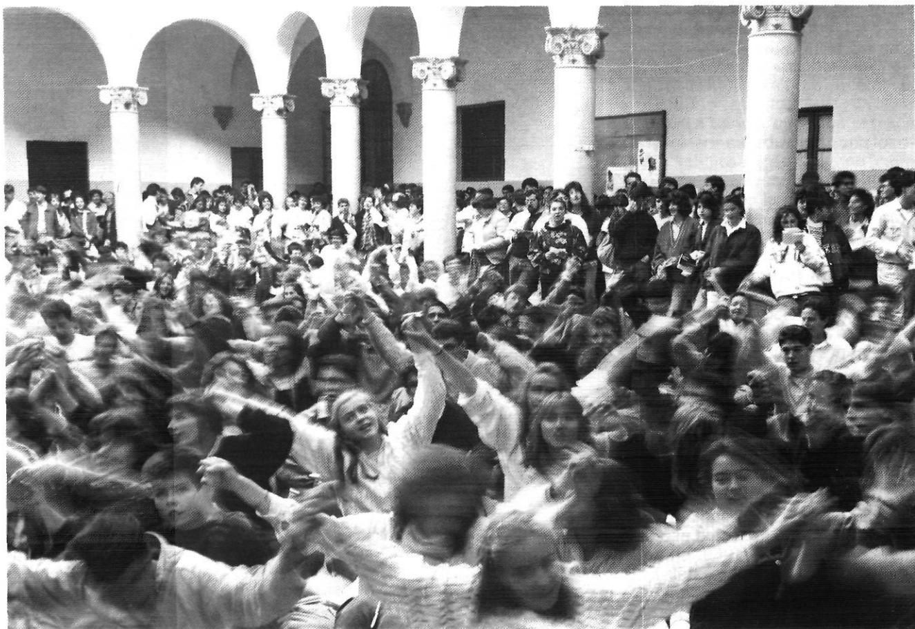
Celebració de la Pasqua Jove: la vida de l'Església es cou a la base de la piràmide.