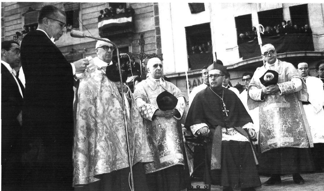
Recepció oficial del bisbe Jubany a la plaça del Marquès de Camps: parla l'alcalde d'Ordís.

En una societat que es secularitza va desapareixent la "plaça" de capellà. És lògic, doncs, que no s'hi presentin candidats. Els capellans que queden són vistos com persones "desplaçades". És cert que encara hi ha gent que els utilitza de tant en tant per legitimar o per servir de suport a la seva inèrcia o al seu sentit màgic de la vida. Però en