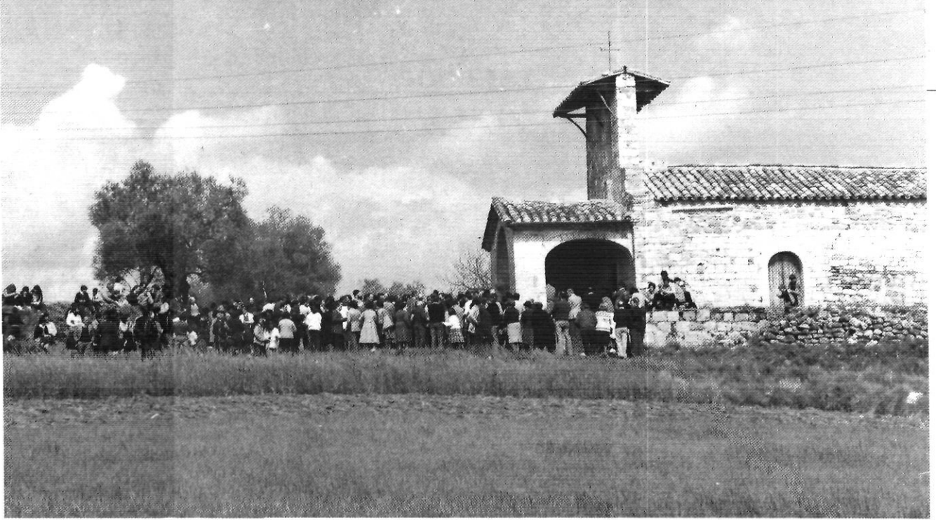
Aplec de Fontcoberta 1983: la Comunitat redescoberta com una idea fecunda i dinàmica.