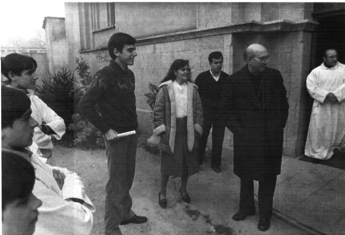
El bisbe Camprodon sintonitza molt amb les idees i l'esperit del Concili.