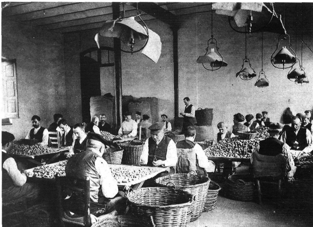
Tapers d'una fàbrica de Sant Feliu de Guíxols.

abre nuevos horizontes hacia un lisonjero porvenir para la clase trabajadora. En esta Asamblea dió la clase trabajadora la sensación más sublime de su capacidad orgánica” 13 .