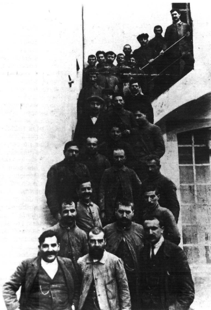
Treballadors de la important fàbrica Coma i Cros, de Salt.

fes el que cregués millor en relació a elles, però l'organització obrera restava al marge, ja que eren considerades com un conformisme dins de l'ordre social burgès. Es ressaltà que l'única força treballadora era l'organització obrera.