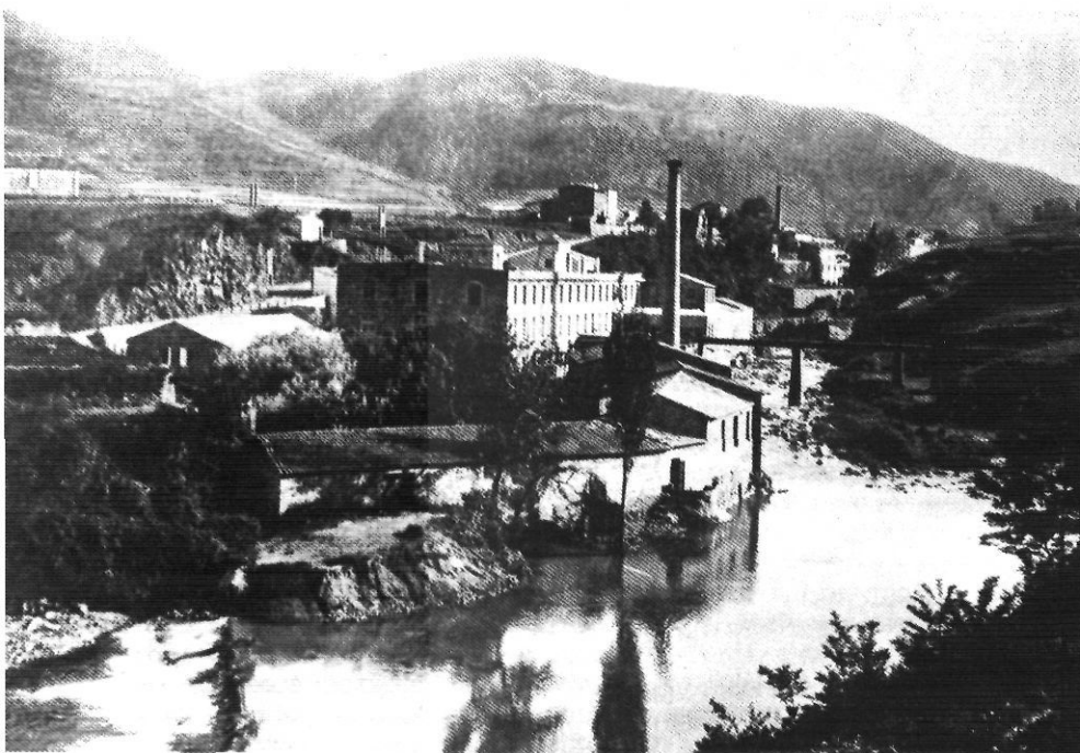
Fàbriques de paper i teixits vora el Fluvià, a Sant Joan les Fonts.

El congrés significà el començament d'una nova era en la història del moviment obrer català, caracteritzada per l'organització dels obrers