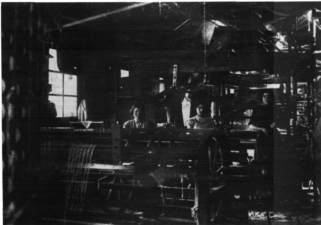
Quadra de telers a Arbúcies (1919).