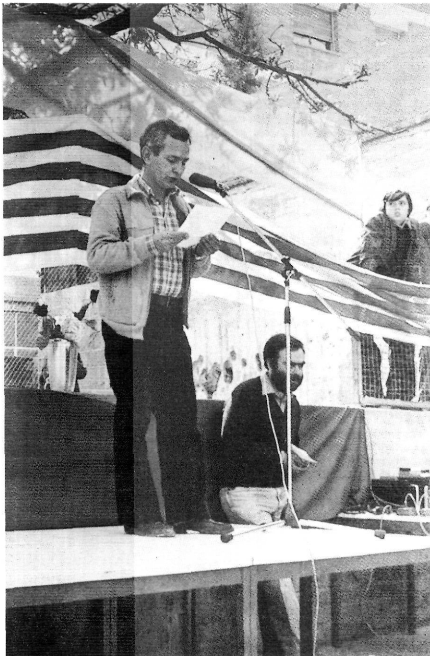
1979: "Un país que mai no havia pensat en el dret a l'educació per a tothom".