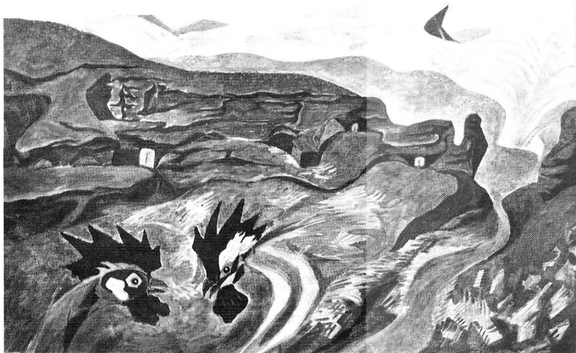
El paisatge aragonès pintat per André Masson l'any 1935, durant l'època de la seva estada a Tossa.

Ara hem de recordar André Masson, que ha mort a París als 96 anys. Pintor, escultor, dibuixant, il·lustrador i escenògraf, després de ser un dels grans representants del surrealisme va refugiar-se als Estats Units on, de 1941 a 1945, va decantar-se per l'abstracció i l'informalisme i va crear l'expressionisme abstracte. Però abans de tot això, de 1934 a 1936 —pel juliol, la guerra el va fer fora— Masson va viure a Tossa, va tenir-hi dos fills i va integrar-se en el grup de tants artistes que hi sojornaven. Va ajudar a crear i mantenir l'ambient característic de la Babel de les arts amb els seus convidats