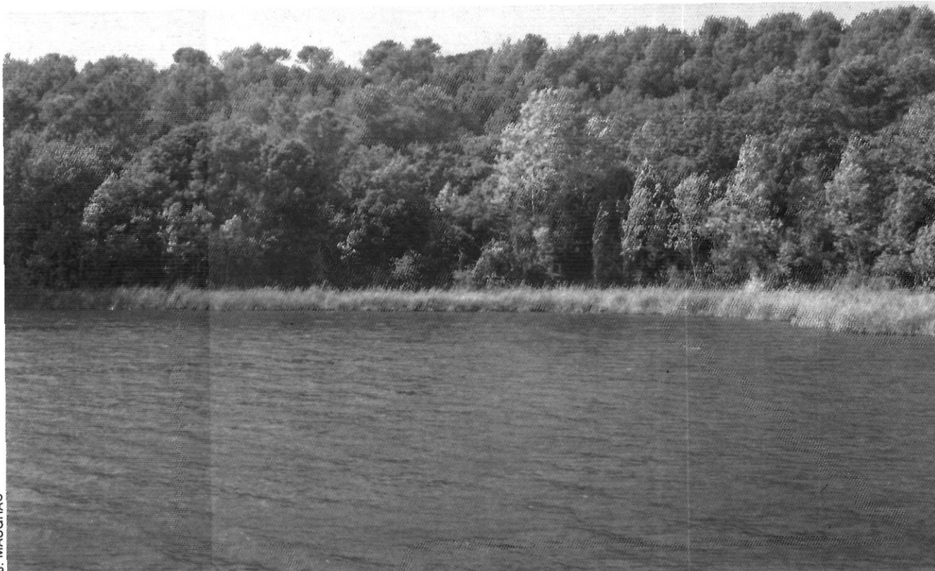
La vegetació de l'estany de Banyoles es disposa en bandes concèntriques en relació a un gradient hídric. En primer terme el canyisasar, segueix el bosc de ribera i, al fons, l'alzinar amb pi blanc.