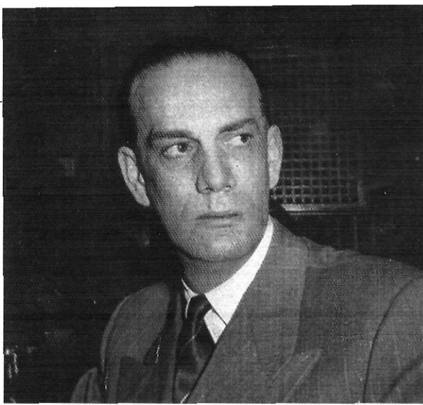
Camilo José Cela a l'època en què parlava del Ter.