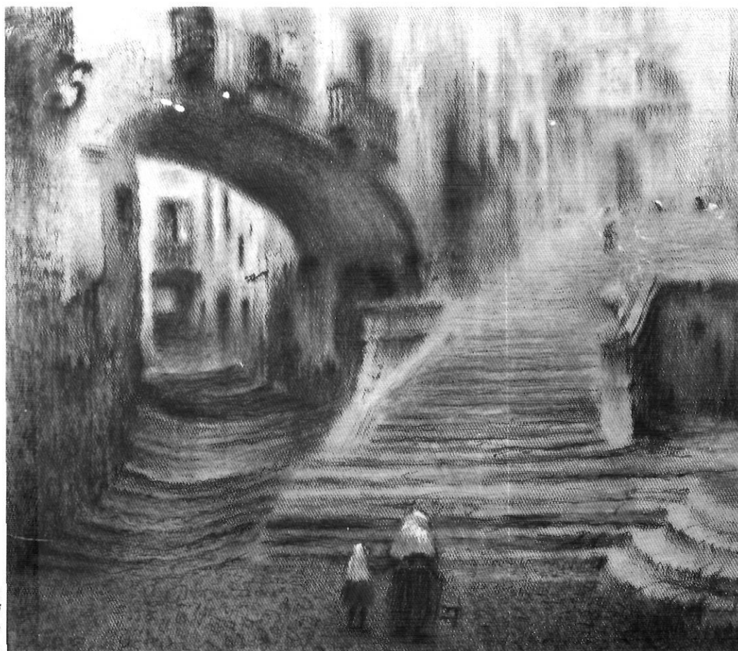
Un conjunt de pedra cisellat pels homes i pel temps (Pastel de Josep Aguilera).