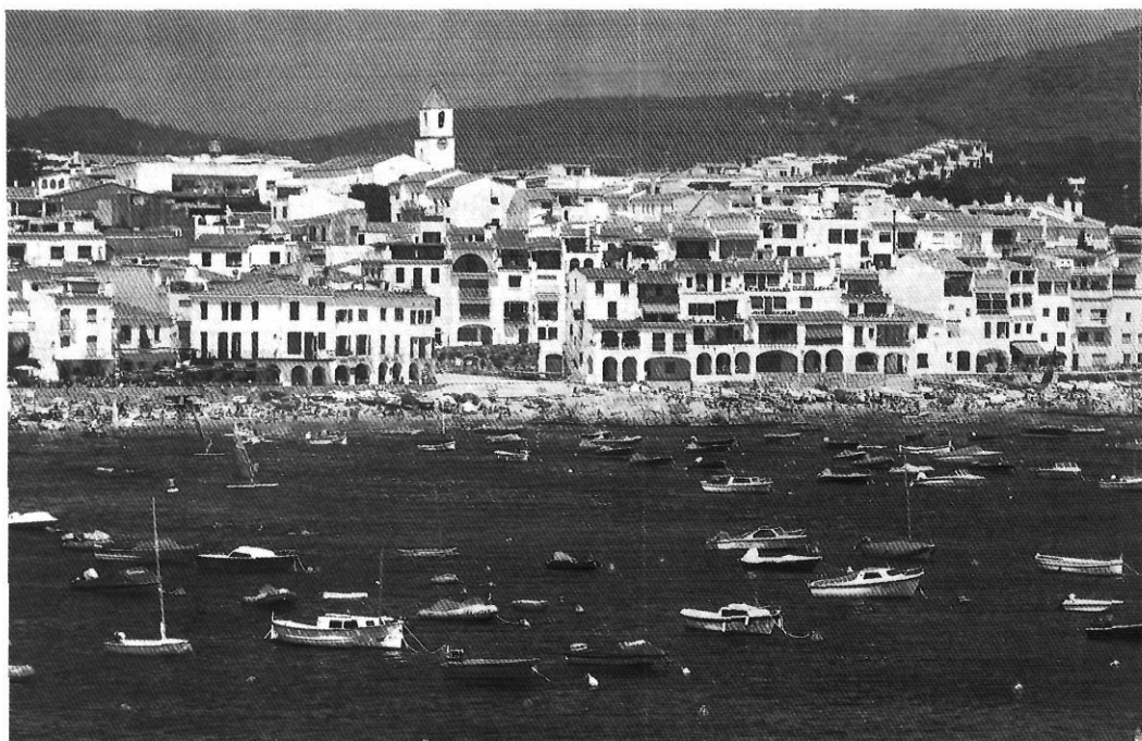
Calella de Palafrugell: s'ha acabat el silenci que es podia escoltar i tocar.

Tot això s'ha acabat. Torno a Calella, un cop més, per comprovar que aquell encís s'ha perdut. Fa set anys que al bell mig del nucli tradicional s'hi va obrir una discoteca. El seu soroll escandalós s'escampa insuportablement tota la nit, tota la matinada. Els carrers són envaïts per bandes incontrolades. Hi ha crits, hi ha corredisses, hi ha baralles; llueixen els ganivets sota el patètic teló de fons de la droga. Hostes inesperats s'han fet amos de tots els racons; trenta, quaranta, cinquanta personatges estraforaris regnen sense llei pels carrers familiars de Chopitea, Gravina, Miramar, Bofill i Codina, Pep Gilet. Ocupen les entrades de les cases, dormen a les escales dels apartaments, beuen a través de la finestra d'algun establiment que es vol estalviar l'impost d'ocupació de via pública. La netedat ha desaparegut. La seguretat del ciutadà s'ha posat en dubte. L'ordre públic és cada cop més problemàtic. I el soroll, com el símbol visible d'aquest gran desordre, trenca impudicament aquell antic silenci que es podia escoltar i tocar; un silenci que semblava pastat expressament per embolcallar les Voltes i per fer de coixí a les onades. Allà on Pla sentia l'alegre ressò de la forquilla sobre el plat, allà on el clavicémbal podia sonar plàcidament en la pau del capvespre, l'estridència més desafinada ens persegueix i ens agredeix tot-hora com una maledicció descarada i constant.