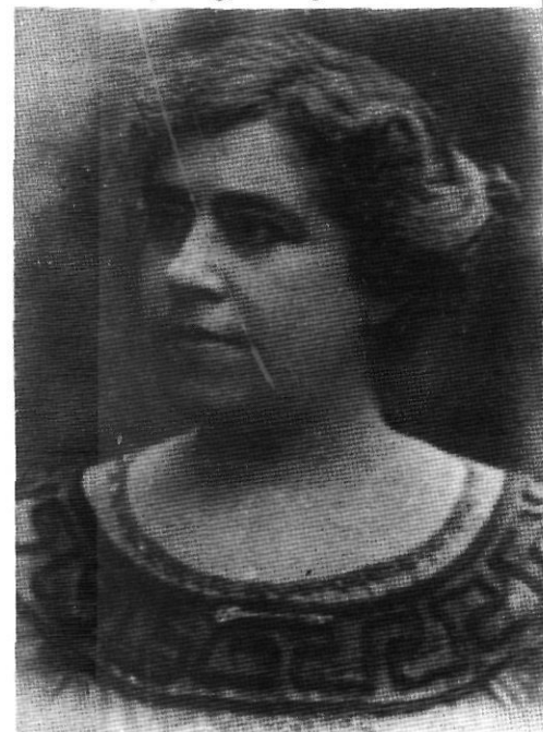
Víctor Català, un prodigi d'imaginació.

Ara veurem si el paisatge real del cinema és capaç de reproduir la presència i la força viva d'aquell món que, segons sembla, la novel·lista va fer emergir portentosament del no-res.