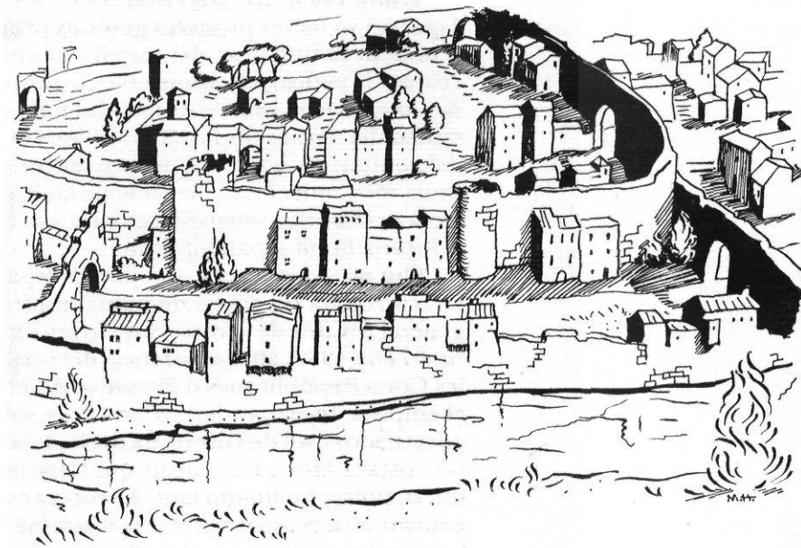
L'antic espai urbà paral·lel a la muralla i al riu (Les primitives Ballesteries en un dibuix de Mercè Huerta).

En la feixuga operació de rehabilitar la ciutat vella, una aportació com aquesta és fonamental, perquè revitalitza el nucli amb l'activitat que li és pròpia: la que ha donat noms als seus carrers i ha configurat el tarannà de la seva gent a través d'un procés secular. Per això entrar, el dia de Tots Sants, en el món bigarrat que comença a partir dels Quatre Cantons i arriba fins a l'església de Sant Feliu no és només endinsar-se en el passat, sinó submergir-se de ple en l'essència de Girona.