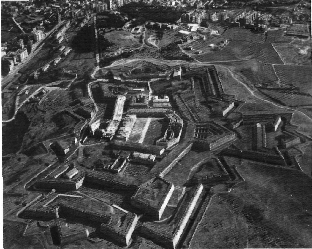
El castell de Sant Ferran, enorme baluerna desaprofitada.