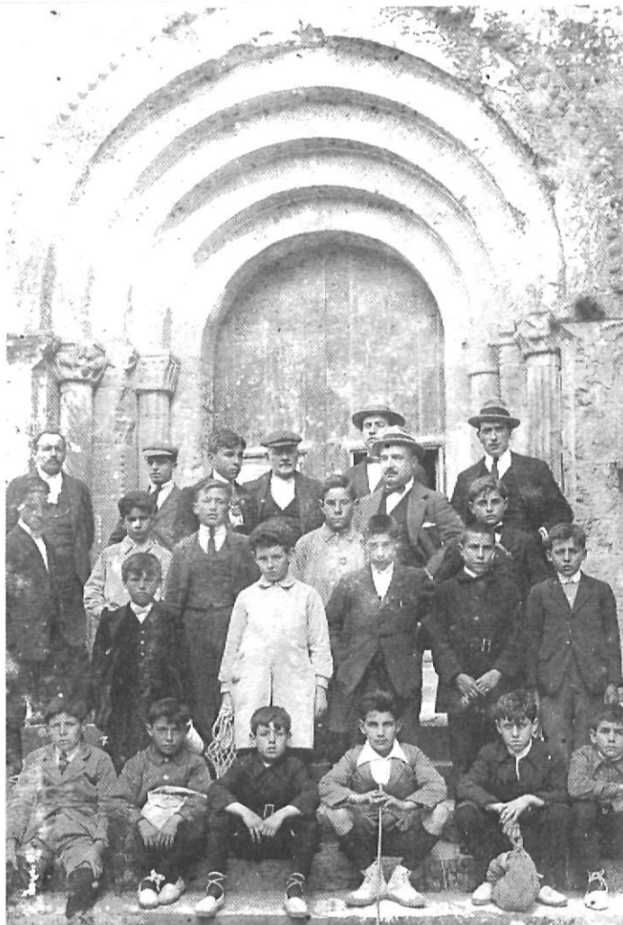
Sota la direcció de Costal, van abundar a la Normal les visites d'estudi, com la feta l'any 1915 a Sant Pere de Galligants.

primari apassionadament, connectà immediatament amb tot aquest torrent de renovació. Convertí la seva càtedra en una plataforma d'engrescament per a la dignificació del magisteri i de l'escola primària.