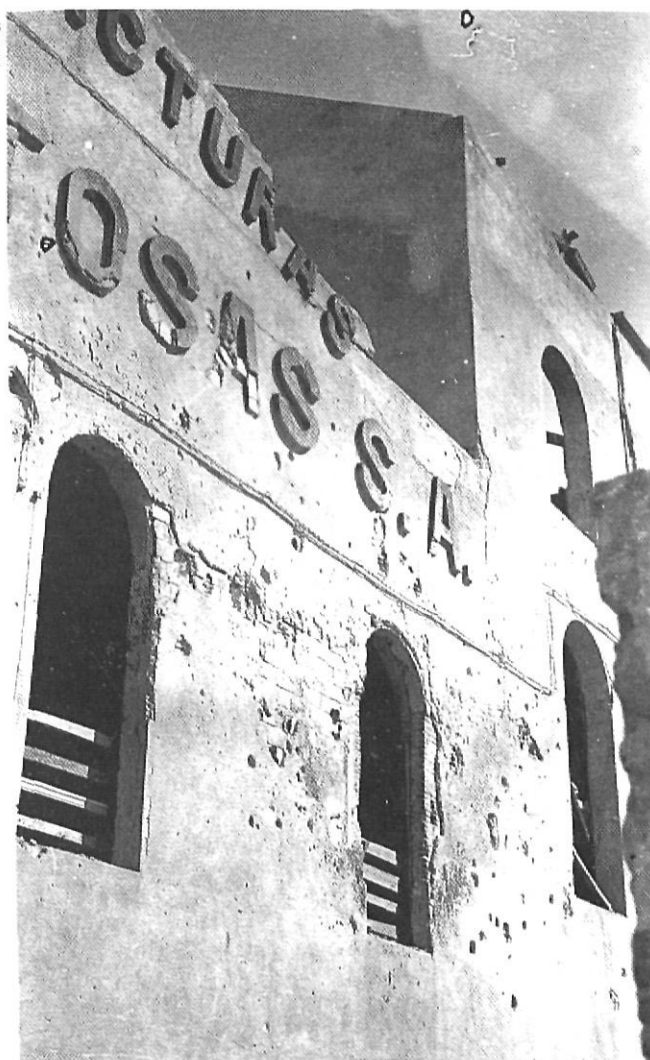
El 5 de desembre de 1938 van caure deu bombes a la fàbrica Tossas, ja afectada per un bombardeig anterior.

mañana del día de hoy, a eso de las siete, un avión faccioso que ha pasado encima de Blanes dirección Este-Oeste, ha dejado caer sobre la fábrica S.A.F.A., que se halla enclavada a dos Km. de la población, unas tres o cuatro bombas de gran tamaño derrumbando un cuerpo de edificio donde estaban instaladas las manipulaciones de preparación de fabricación de rayón a que la fábrica se halla dedicada. Ha quedado destruida toda esta parte de edificación no habiendo que lamentar desgracia personal alguna" 10 .