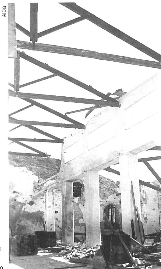
Un altre aspecte de les naus industrials de Tossas després de l'atac de l'aviació.