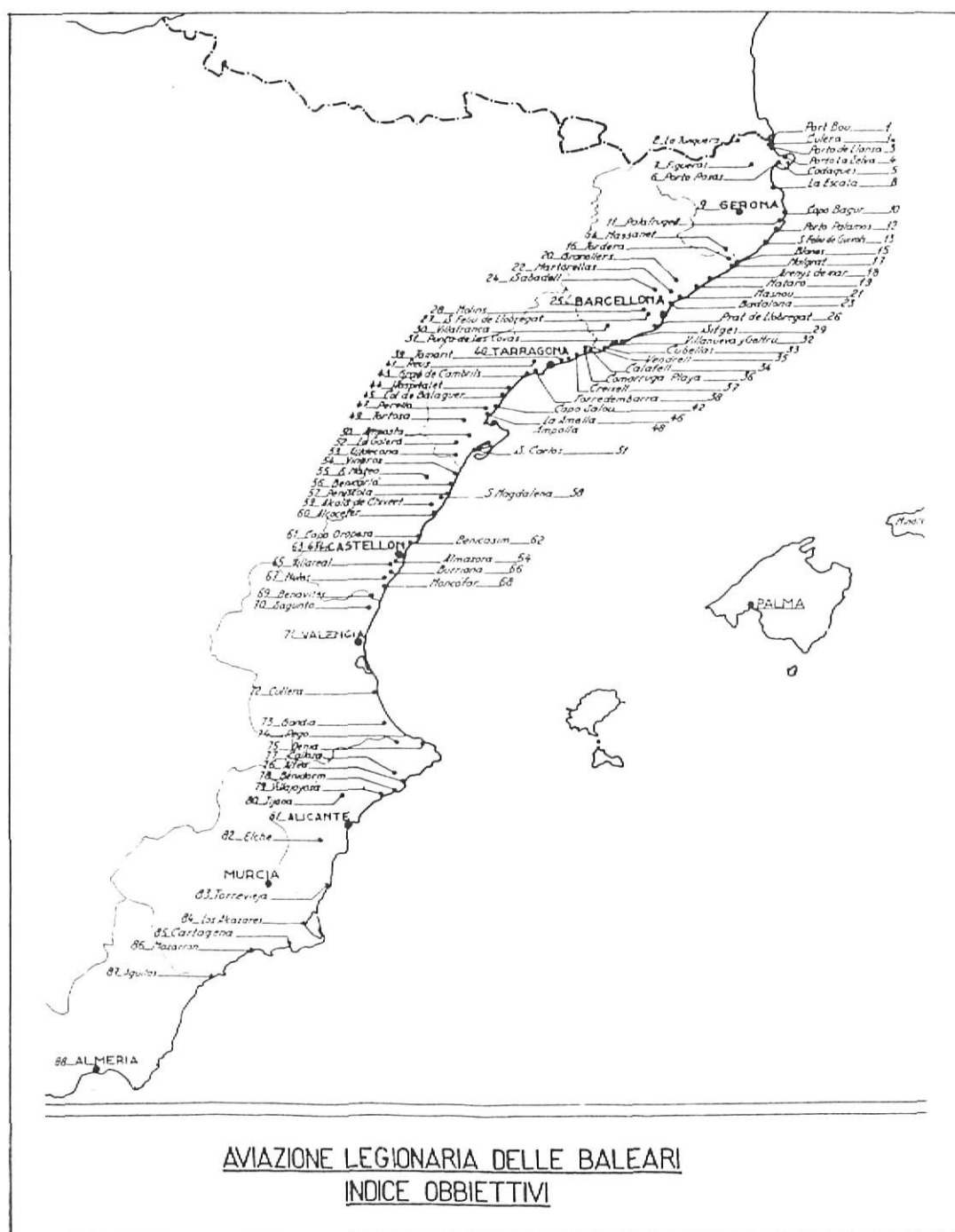
Plànol dels objectius de l'aviació legionària italiana a la costa mediterrània.

Coincidint amb l'ofensiva republicana del mes d'agost de 1938 a l'Ebre la vila de Blanes va viure en un estat de tensió continuada, ja que les ales negres s'hi presentaren per causar estralls els dies 13, 15, 16, 18 i 22 d'agost.