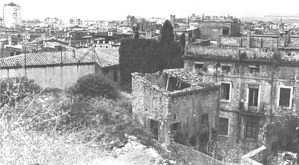
Les construccions annexes als Maristes que no van ser enderrocades i que donen al carrer del doctor Oliva i Prat han de ser estudiades amb cura, segons els arqueòlegs. Ara es troben en molt mal estat.