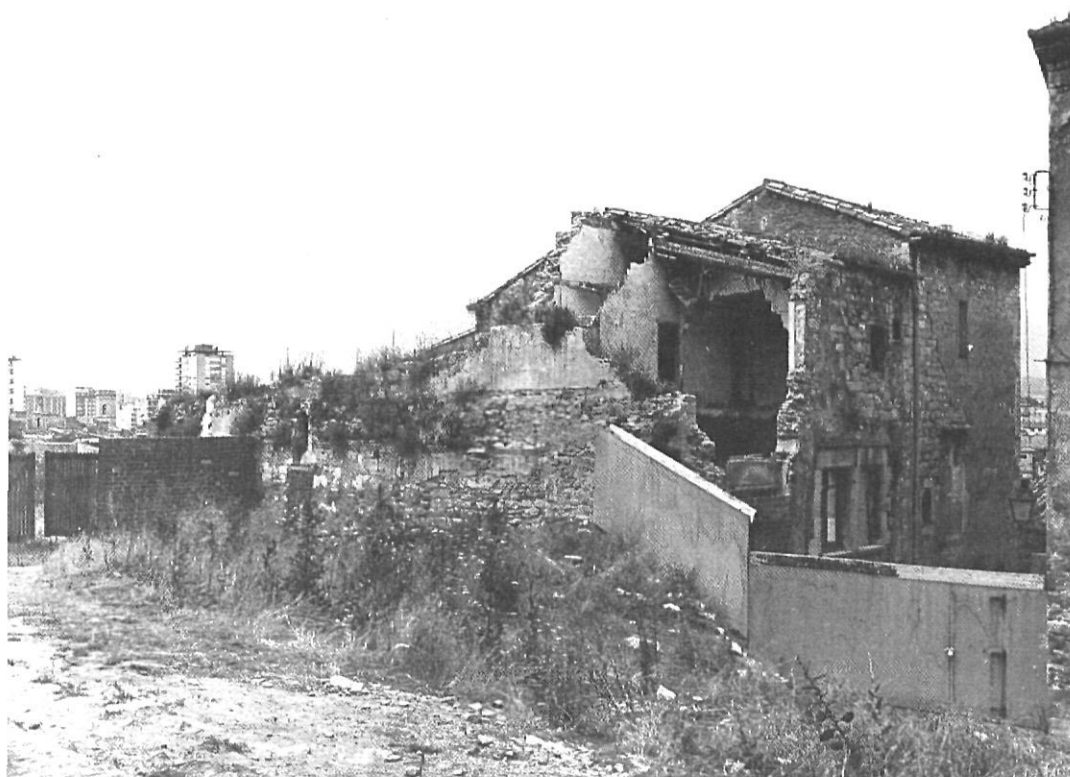
La rehabilitació de l'edifici que dona al carrer del doctor Oliva i Prat tampoc no està contemplada en la primera fase de les obres que ara surten a subhasta.