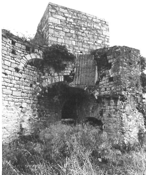
Un dels més esplèndids i més misteriosos racons de la muralla de Girona és visible només des dels patis de les cases del carrer Bonaventura Carreras Peralta.

Aquests darrers dies, però, la premsa de la ciutat ha fet referència, sovint, a l'inici immediat de les obres de remodelatge i millora de l'espai que ocupà l'antic col·legi dels Maristes enderrocat ara fa uns anys, obres encarregades i subvencionades pel Departament de Política Territorial i Obres Públiques de la Generalitat que, cal suposar, comptarà amb el vist-i-plau de l'ajuntament de la ciutat. I aquesta és una actuació que acabarà essent bàsica per veure si realment ens trobem, pel que fa a l'in-