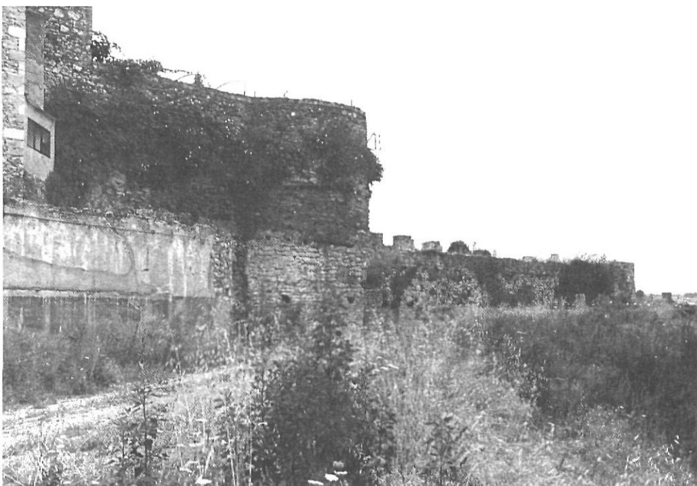
La torre rodona i la muralla, vistes des del solar dels Maristes. L'enjardinament haurà de respectar i revaloritzar aquest conjunt.

Aquesta primera fase suposarà dotar el barri vell d'una plaça urbana i un petit parc. En el punt de