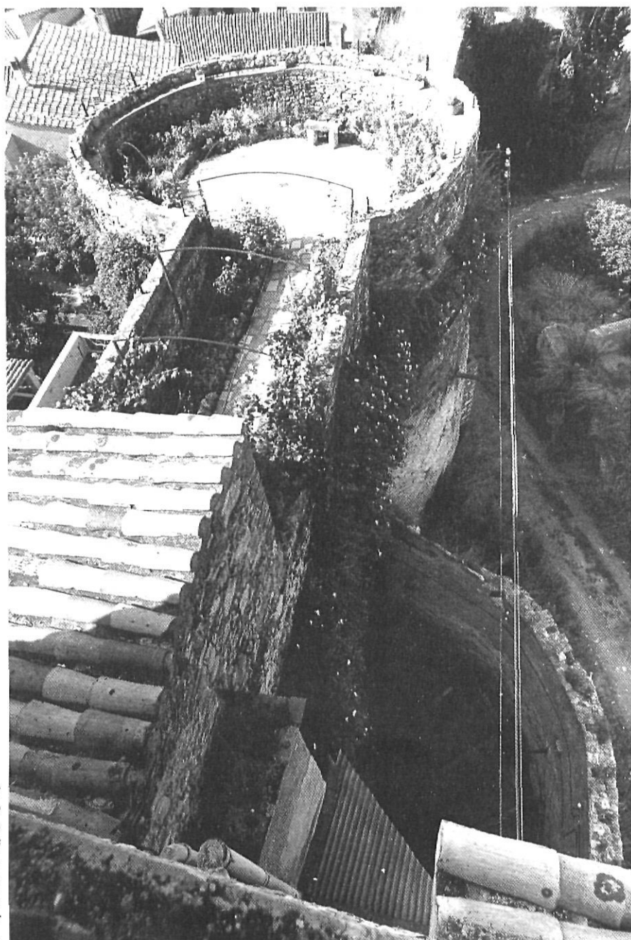
La torre rodona pertany ara a les monges de clausura del carrer de l'Escola Pia i només s'hi accedeix des del seu convent. L'han convertit en un petit pati. Als seus peus, a la dreta, el solar dels Maristes.

El projecte preliminar d'actuació en aquest sector, que encara no ha estat aprovat definitivament per la Comissió Provincial de Patrimoni, convertia tot el sector en un jardí, recuperant-lo per a la ciutat i embellint una