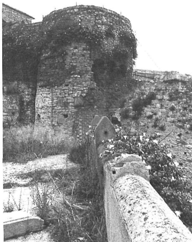
Els qui tenen curiositat per conèixer racons amagats de Girona han de fer ara equilibris per accedir al cim de la muralla unida a la torre rodona. Uns forats als maons del mur de reforç són la única via d'escalada. L'enjardinament del lloc farà més fàcil la visita.