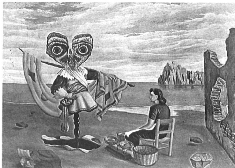
Una obra característica d'Àngel Planells.

Per causes que s'haurien d'explicar, l'obra de Planells va perdre progressivament l'empenta inicial i la seva projecció exterior ha estat limitada.