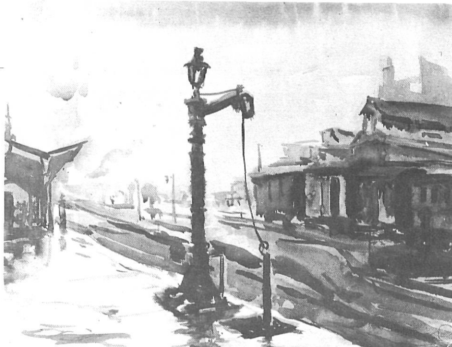
Mala entrada de Girona: l'estació del tren, en una aquarel·la de Joan Riu.

“Una reconditez tan hundida y tan apacible que evoca inmediatamente el concepto de lejanía, de triste y desagradable lejanía (...). La impresión instintiva de lejanía me llenaba de incertidumbre el corazón”.