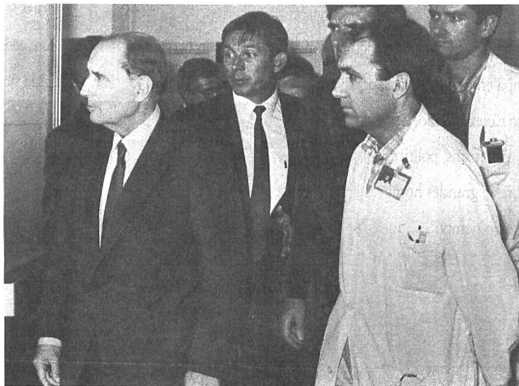
François Mitterrand, president de França, en el moment d'entrar a l'Hospital Álvarez de Castro.