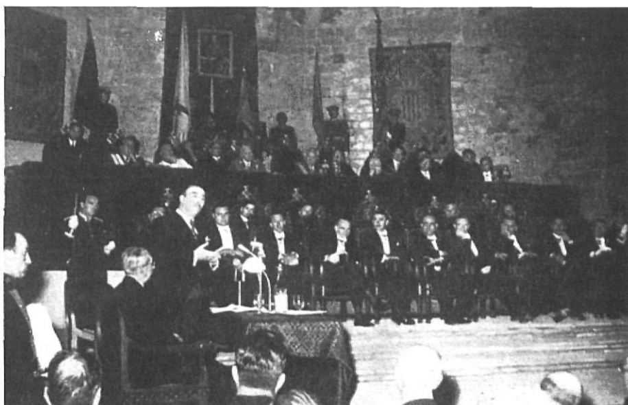
Discurs de Díaz-Plaja a l'acte acadèmic-polític del 150 aniversari dels setges de Girona.