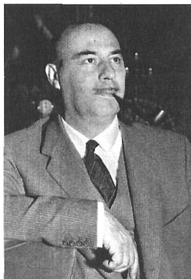
Guillermo Díaz-Plaja: la ciutat oficialment heroica dels anys 40.