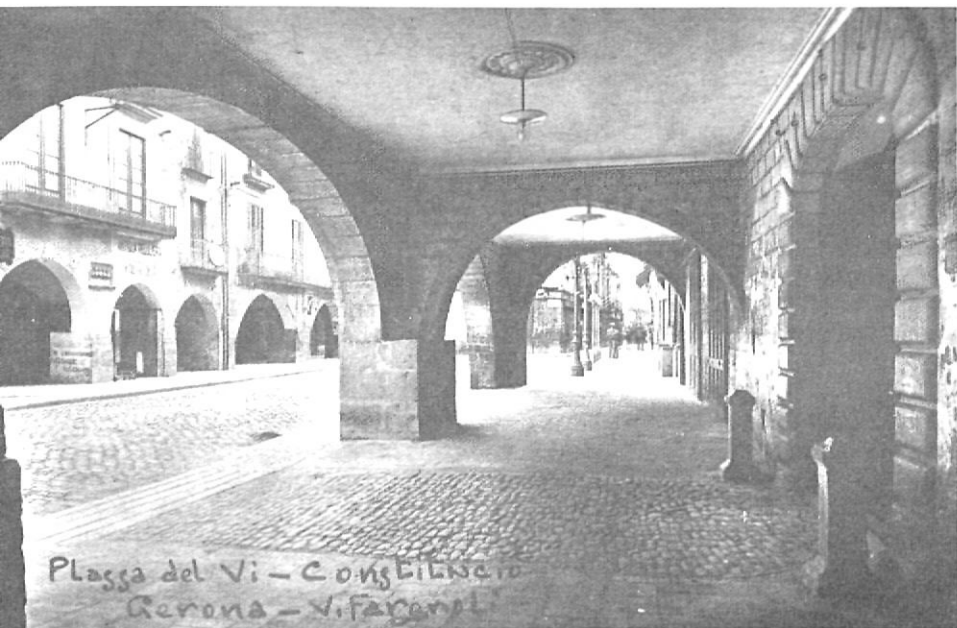
En la plaça del Vi tingueren lloc els aldarulls que van obligar les autoritats absolutistes a proclamar la Constitució de Càdis al 1820.

Aquest panorama tan negatiu s'agregà amb l'incompliment de les exempcions tributàries promeses per la monarquia a la ciutat de Girona, en recompensa de l'esforç i sacrifici demostrat en els setges famosos. El governador, José García de Velasco, solucionava les seves necessitats pecuniàries dictant contribucions especials, que compensaven l'exempció del cadastre durant 10 anys. Segurament que l'estat l'ajudava ben poc, ofegat per la crisi hisendística, però això no disculpa la seva actitud prepotent ni la duresa amb què tractava la població. Ja al 1817, el Capità General de Catalunya, Javier de Castaños, va cridar-li l'atenció a causa de «los agravios, disgustos y bochornos con que le afflige el Teniente General Don José García de Velasco, gobernador de esta plaza, y al mismo tiempo la dureza con que