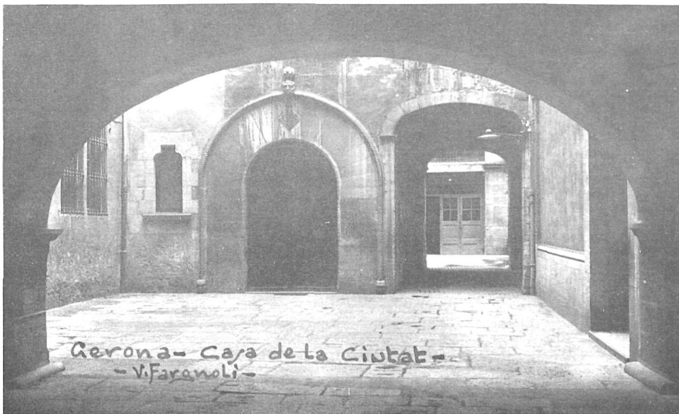
L'Ajuntament fou un centre de poder controlat per l'oligarquia nobiliària local durant molts anys.