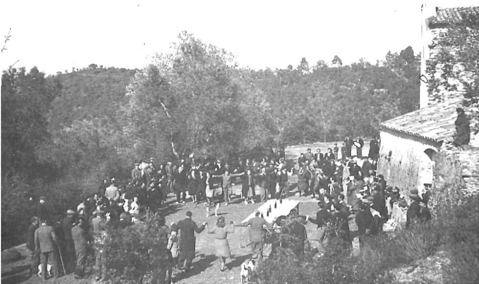
Aplec davant l'ermita de Santa Llúcia, terme municipal de la Bisbal, l'any 1942.

diumenge de Sant Vicenç, per la setmana dels barbuts, a mitjan gener. Fa sis o set anys que la Colla Excursionista Cassanenca (C.E.C.) s'ha fet càrrec de l'organització. Hi ha concursos de pintura ràpida, concurs d'allioli... etc.