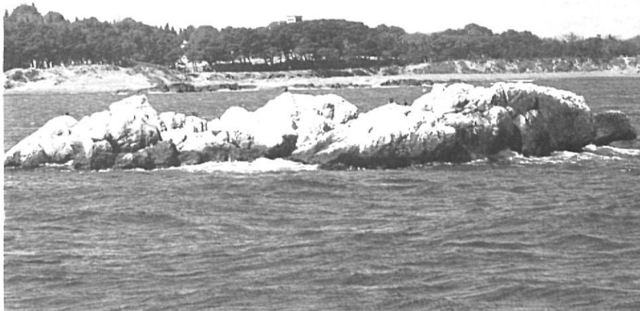
Mar, plana i muntanya: imatge i oferta úniques.

• A vegades costa de dir en poques paraules què és i què significa una multinacional. Tenim a mà un exemple esclaridor. Cada any, una empresa instal·lada i arrelada a la Garrotxa edita un calendari de fotografies amb un tema monogràfic, vinculat amb temes del seu territori. N'hi havia un d'admirable sobre les ermites romàniques de la vall de Bianya i el de l'any passat, sense anar més lluny, era dedicat a paisatges típics d'Olot, amb una introducció esplèndida de Joan Teixidor. Doncs bé: ara aquesta empresa s'ha integrat en una multinacional americana. I als calendaris d'enguany, les fotografies en color són dels directius del grup i de les instal·lacions de l'empresa a Espanya, a Gran Bretanya, a la República Federal Alemanya i sobretot a USA. Els paisatges d'Olot han deixat pas a les naus industrials de Wayne, Stanford, Pearl River, Bound Brook i Princeton.