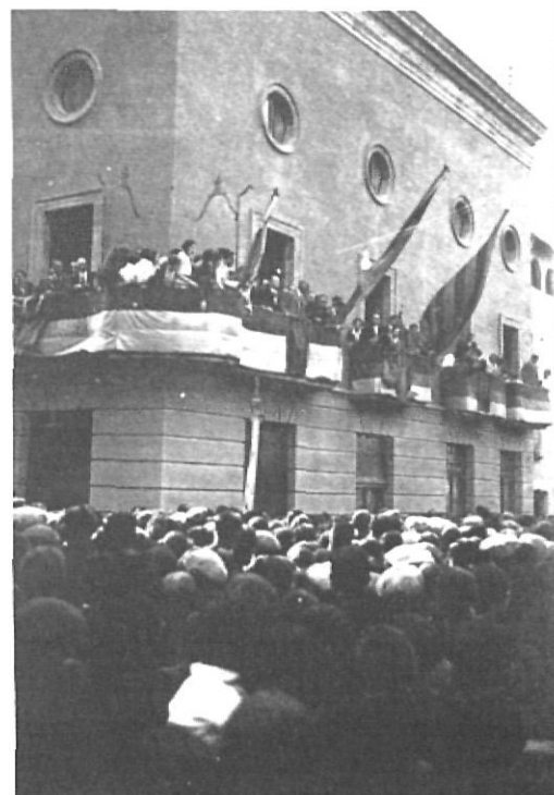
El president Macià, amb l'alcalde Lloberas, al balcó de l'ajuntament de la Bisbal, l'any 1931.

Han passat molts anys, ha caigut molta aigua per la presa de Susqueda, el senyor Duran ha anat acumulant molts càrrecs, simultanis i successius, i ara sembla haver arribat a un estadi superior més enllà del bé i del mal. Amb aquest bagatge ha tornat a Girona i ha pronunciat a la Cambra de Comerç una conferència (que després ha repetit quasi literalment al Col·legi d'Enginyers de Barcelona) en la qual ha confesat allò que ell ano-