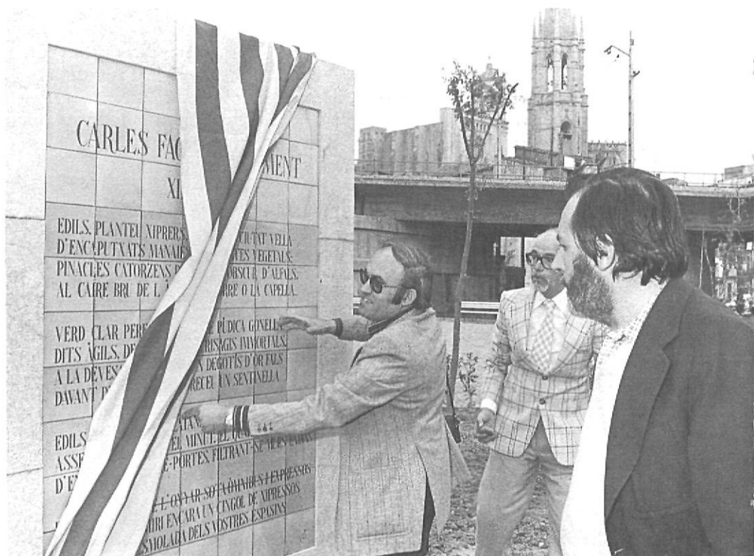
Les rajoles amb el sonet de Fages de Climent, el dia de la inauguració.

• Un destacat fullet publicitari de Girona, farcit d'anuncis de botiguers segurament sorpresos en la seva bona fe, inclou, entre les tres úniques fotografies de la ciutat, aquesta imatge realment pintoresca i suggestiva. No diu, però, que es tracta del document gràfic d'un antic aiguat. El foraster buscarà en va aquesta Argenteria navegable, aquesta Venècia impossible que de record històric s'intenta fer passar irresponsablement a la categoria de fals atractiu turístic.