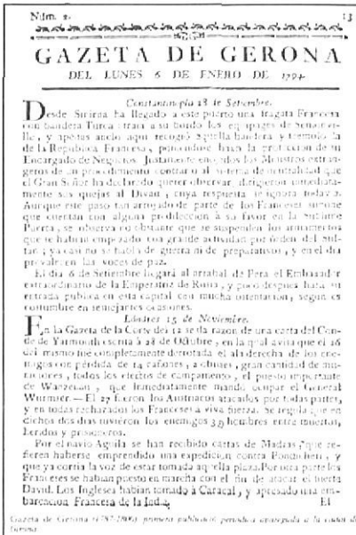
“Gazeta de Gerona” (1787), primer periòdic de la ciutat.

No hi ha res més fugaç que les pàgines dels diaris, que neixen a l’hora d’esmorzar i al migdia ja són vells. Però en el moment de morir, si passen als prestatges de les hemeroteques, els diaris comencen una nova