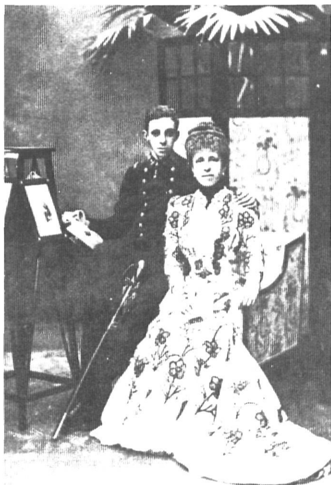
Alfons XIII amb la seva mare, la reina Cristina, pretext de la sanció contra el director de "El Demócrata".

Has nacido apenas y ya se cierce en la atmósfera el humo de la pólvora que, con su brillante relampaguear y fragoso estampido, cierra tus ojos a la luz y turba la tranquilidad de tu primer sueño.