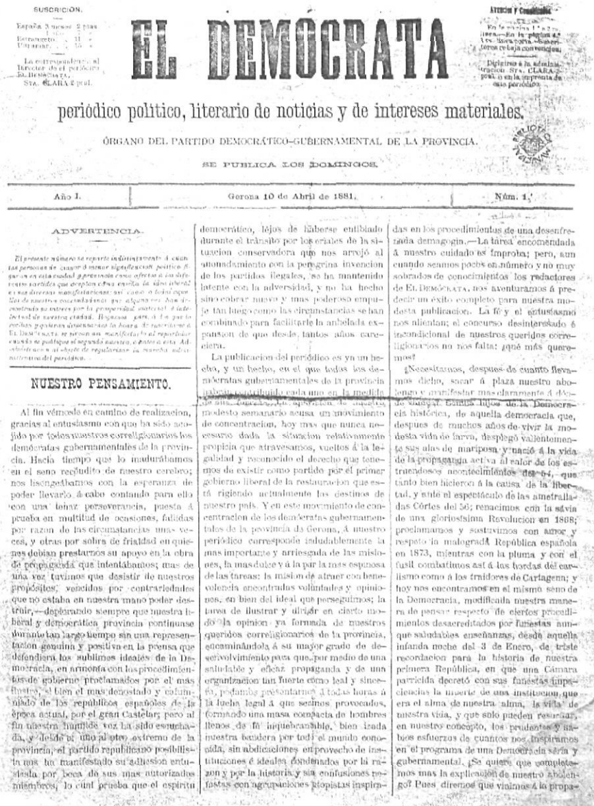
Primer número de "El Demócrata", periòdic polític que era dirigit per Artur Vinardell.

El Demócrata va sortir per primera vegada el 10 d'abril de 1881 com a «periòdic polític, literari, de notícies y de interèses materials» i com a òrgan del partit possibilista d'Emilio Castelar. A la capçalera, s'hi llegia d'antuvi «partido democrático gubernamental de la provincia», però amb el temps la llegenda va ser canviada per la de