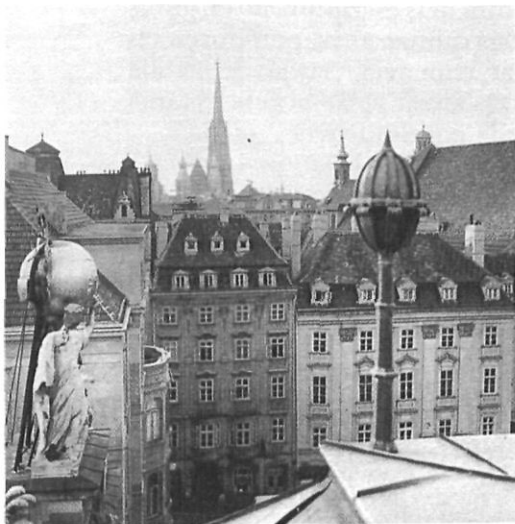
Pasqual Maragall recorda que Viena és a 300 km. de Budapest, de Praga i de Munic: “Això només passa a Europa”.