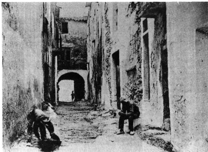
Al Cadaqués d'abans, cada casa tenia una porta oculta.