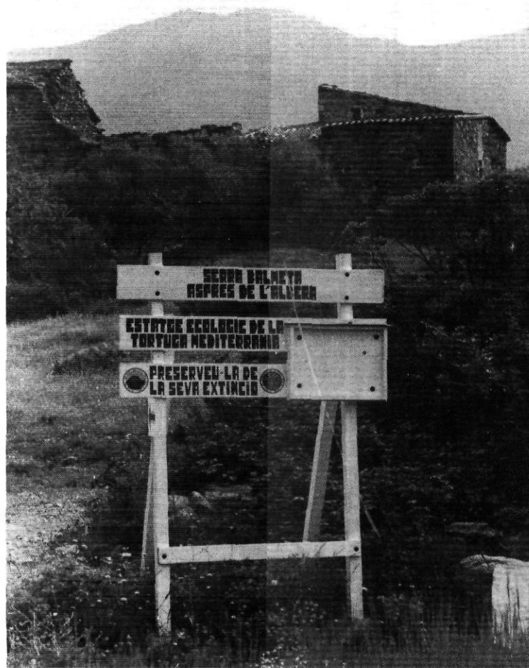
L'Albera, un patrimoni que comença a ser protegit.

Si l'any 78 l'ampliació fou duta a terme mitjançant expropiacions, en aquesta ocasió eren alguns grans propietaris de la zona els qui realitzaren diferents ofertes a l'exèrcit. L'existència de petites propietats entre el camp militar i els terrenys oferts i la negativa de llurs propietaris a vendre aquestes terres impossibilitaren la realització d'aquesta operació.