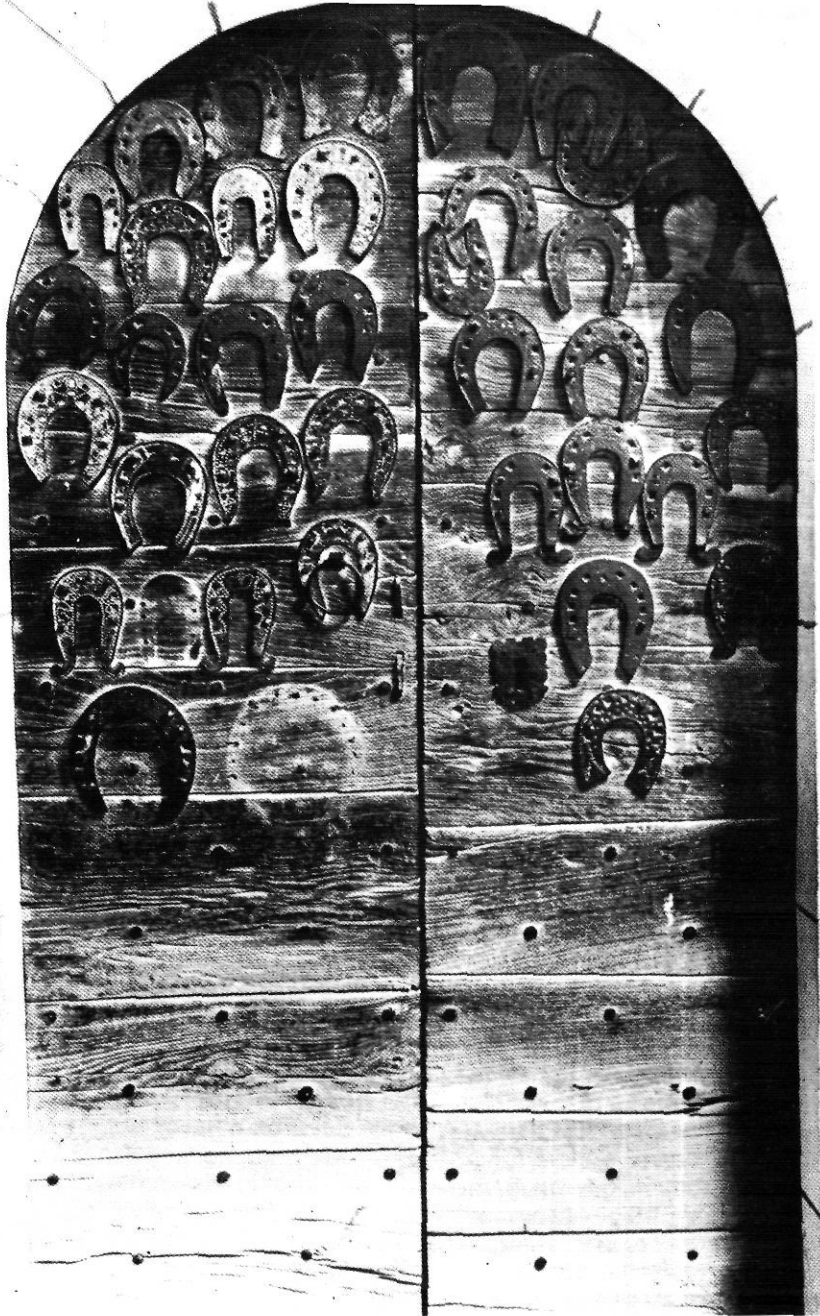
Porta del santuari de Sant Martí de Campdevàrol, amb ferradures votives.

donades per la instal·lació de determinat material o maquinàries. Però, la diversitat d'objectes exposats, de més o menys vàlua econòmica, però de significació i importància impossible d'avaluar, ha estat factible gràcies a les donacions de molts ripollessos de la comarca, que han renunciat a objectes perquè el Museu tingués tota la varietat i importància que ara té. Gent de Campdevàrol, Ribes de Freser i Querolbs, a més de la del mateix Ripoll, han fet possible la concentració.