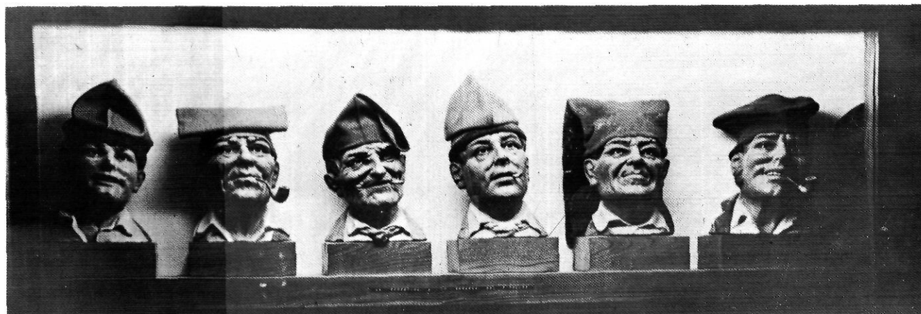
Diverses maneres de portar la barretina al Ripollès.

Aquesta sala és dedicada al Rev. Josep Raguer, i guarda una important col·lecció de figures de pessebre, atuells religiosos, pintures, etc. Entre tanta cosa de valor crematístic i moral, potser cal assenyalar la recopilació que s'ha pogut fer d'un