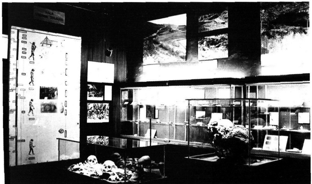
Sala de prehistòria del Ripollès, que aplega materials del paleolític superior a l'edat del ferro, procedents de Sant Joan de les Abadesses, Ripoll, Campdevàno, Ribes de Freser i Queralbs.