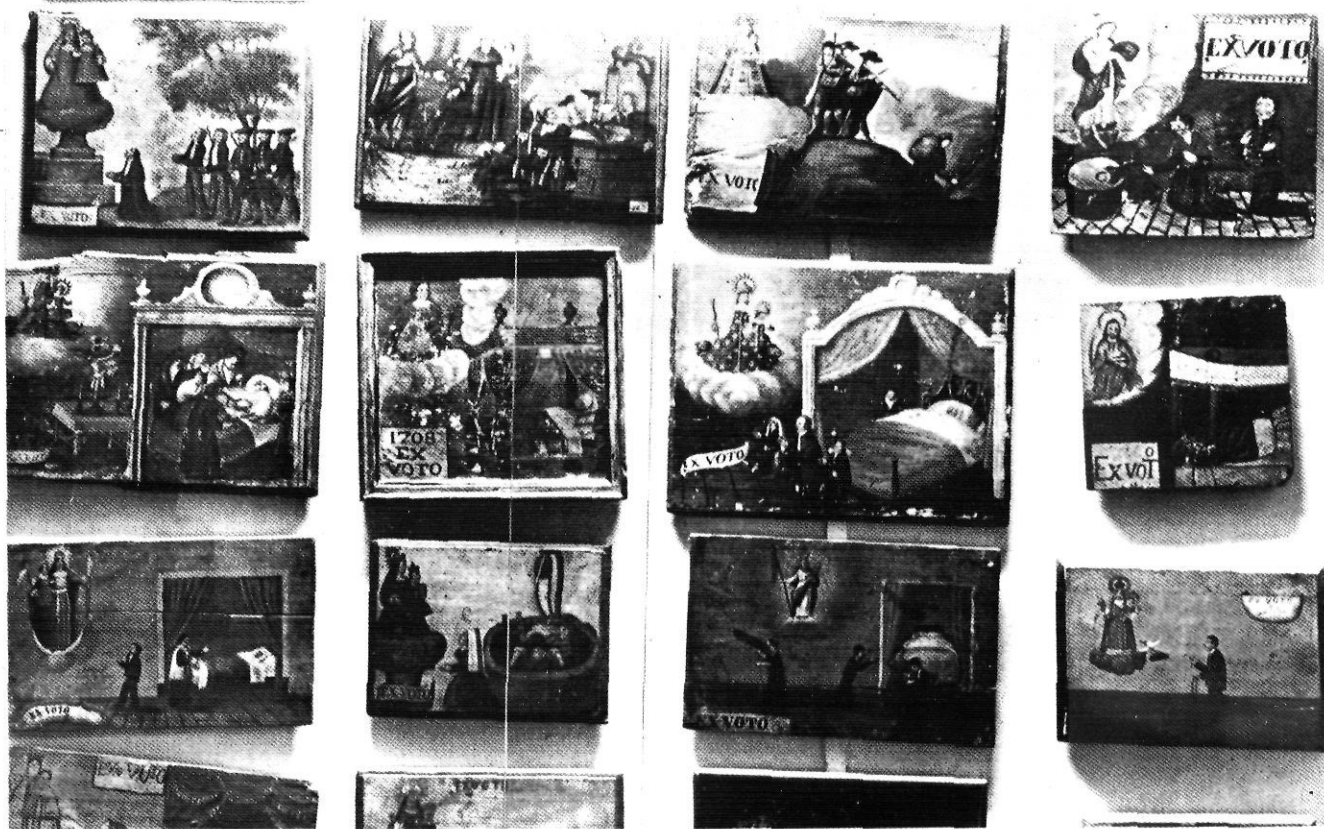
Part de la col·lecció d'ex-vots dels segles XVIII-XIX, coneguts amb el nom de "retaulons" o retaules petits.

total de noranta-set ex-vots pintats sobre fusta. "Retaulons" com en deien, que suposava una de les millors col·leccions de Catalunya, i a més a més, "capelletes de plegadó", única selecció d'aquestes capelletes amb imatges de diferents sants o Mares de Déu, que es portaven per les cases en el moment d'anar a recollir les ajudes o almoines.