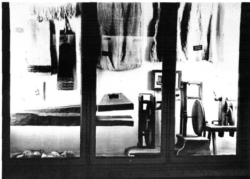
Secció del cànem, de la sala d'Art tèxtil.

terceroles, pedrenyals, escopetes, mosquets, arcabussos i espingardes.