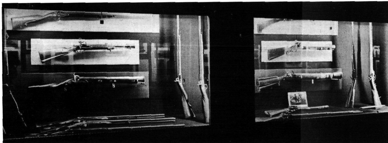
Armes de foc portàtils de la famosa manufactura ripollesa. Segles XVI, XVII, XVIII i XIX.

Al Museu hi ha diversitat de pistoles, carabines, fusells, trabucs,