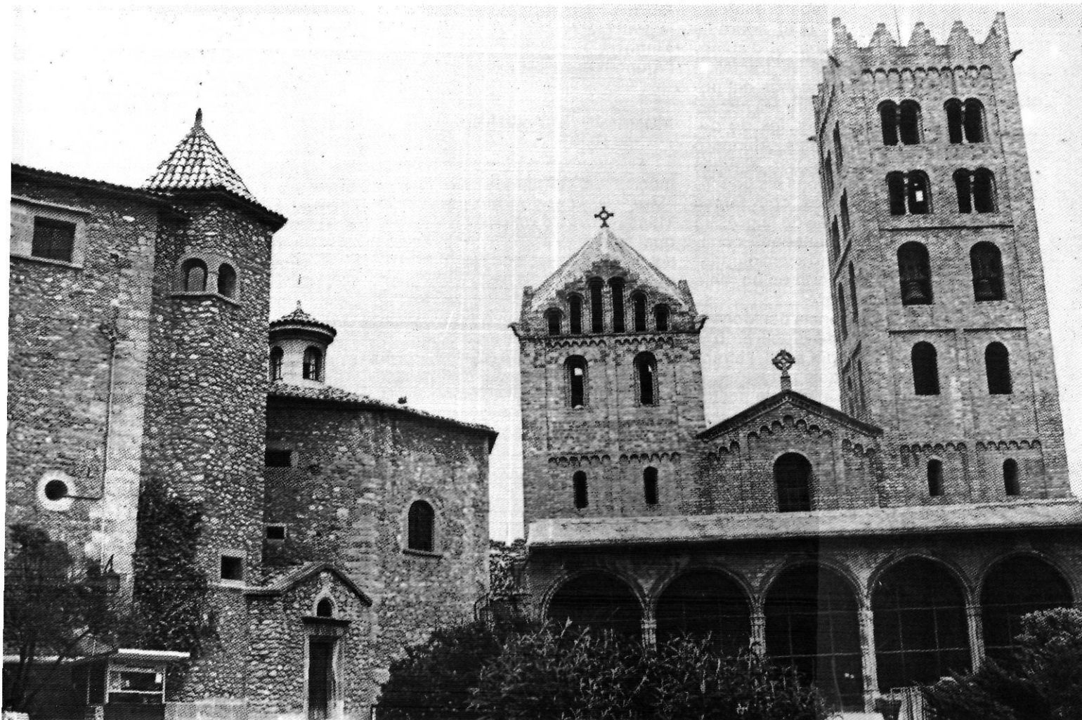
El Museu-Arxiu de Ripoll compta amb el prestigiós veïnatge del Monestir.