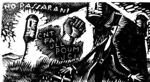
Visca la unitat obrera revolucionària!