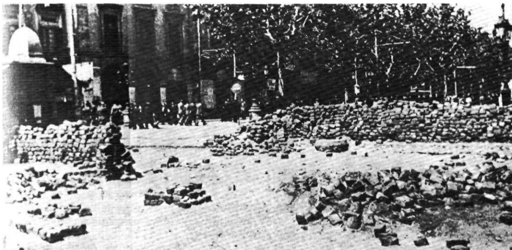
A l'esquerra, una barricada del maig de 1937 a Barcelona. A sota, Frederica Montseny i Joan Garcia Oliver, membres destacats de la CNT i ministres durant el govern de Largo Caballero.

vocà la resposta defensiva dels anarco-sindicalistes, a la qual se sumà el POUM, que ja s'havia manifestat per la constitució d'un govern obrer i camperol, que afirmés el nou ordre revolucionari.