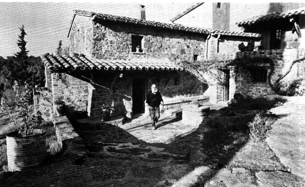
"Les barraques de Can Tista i Montguix es troben en un dels indrets més bonics de la rodalia de Banyoles"