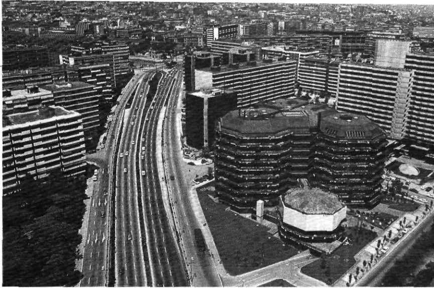
Cap punt de Catalunya no és avui a més de cinc hores de Barcelona. Tot el territori és, doncs, àrea metropolitana.

Terrassa i a Sabadell, ja llavors suburbanes. Tot plegat dóna una franja d'uns 27 Km d'ample a l'altura de Barcelona i d'uns 15 Km a la de Vilafranca del Penedès o de 12,5 Km a la de Sant Celoni.