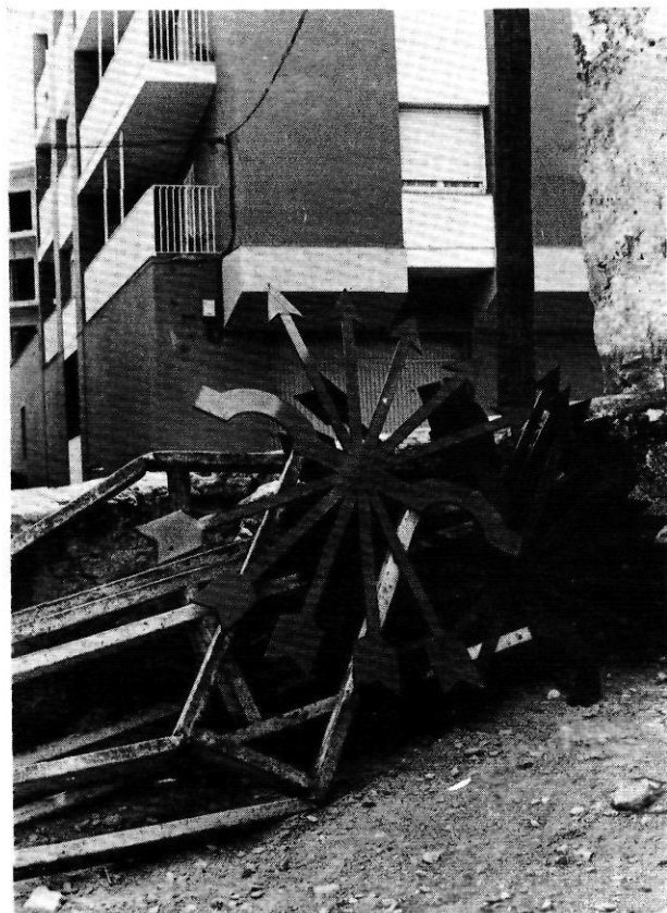
La restauració de la Generalitat, l'any 1977, va ser una magnífica ocasió perduda per aplicar una nova divisió territorial de Catalunya.

El següent tall que trobem en el temps és la gran Geografia de Catalunya , que, entre 1958 i 1974, dirigí Lluís Solé i Sabarís 4 ; l'obra és de més envergadura, amb el treball d'autors i especialistes diversos, i amb dos volums comarcals on és utilitzada aquella divisió de Pau Vila. Dels tres volums, Roser Latorre en publicà un resum en la mateixa col·lecció que havia sortit el Resum de Pau Vila. Entre totes dues obres