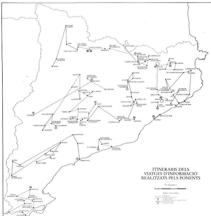
Una de les bases de l'estudi dels ponents van ser els seus viatges d'informació. En el mapa, hi figuren els seus itineraris.

dava resolt, ja que s'establí simplement que "per l'organització i funcionament dels diversos serveis de la Generalitat el territori català podrà ésser dividit en les demarcacions que la llei determini" (Títol IV, art. 58). Aquesta posició fou durament criticada pels grups parlamentaris de la Lliga Catalana i la Unió Socialista de Catalunya, que, per boca, respectivament, de Joan Vallès i Pujals i Estanislau Ruiz Ponseti, criticaren la manca de concreció del text presentat i afirmaren que el tema havia de quedar resolt —almenys en les seves línees generals— en l'articulat de l'Estatut Interior.