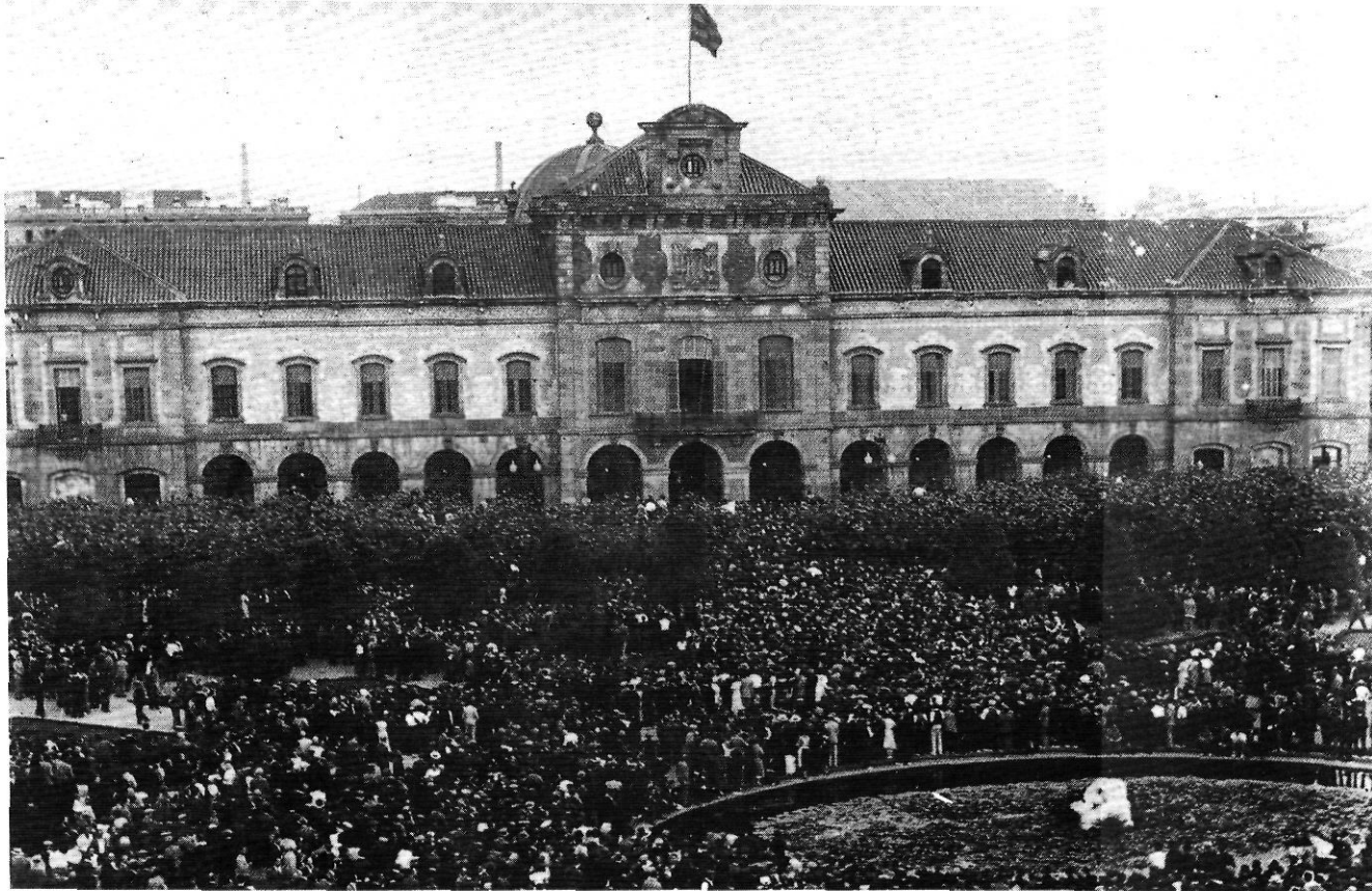
El Parlament va aprovar diverses lleis que implicaven la perpetuació de les antigues divisions. Així, per exemple, la Llei de Contractes de Conreu, ratificada l'any 1934 davant d'una gran concentració.

la divisió i després d'aquest Decret la utilització de la nova organització territorial s'estengué encara més entre les diferents conselleries de la Generalitat. Fins i tot el Govern de la República l'adoptà per a l'organització dels seus serveis a Catalunya (com les Juntes de Proveïments o les Juntes de Defensa Pas-