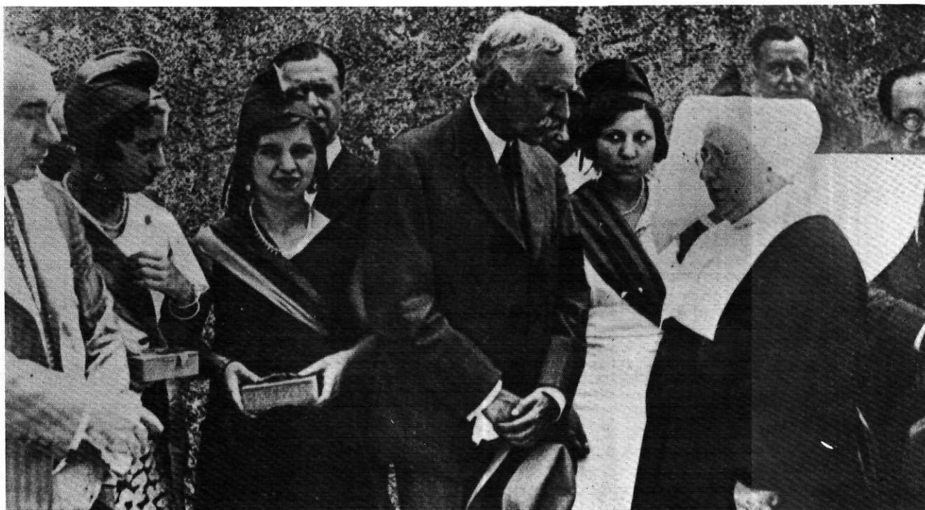
Francesc Macià —a la fotografia, durant una visita a Palamós— va proclamar la República "amb el cor obert a totes les esperances". Però, pel que fa a la divisió territorial, van ser unes esperances fins a cert punt infundades.

nya, aprovat per les Corts de la República i promulgat el 15 de setembre de 1932: L'article 10 de l'Estatut establia que, per a procedir a l'ordenament de l'administració local "la Generalitat podrà establir dins de Catalunya les demarcacions territorials que cregui convenients". Però aquest apoderament de l'administració autonòmica en matèria de divisió territorial afectava exclusivament l'organització dels serveis que l'Estatut li atribuïa, mentre que l'Estat central podia mantenir perfectament a Catalunya la seva administració perifèrica estructurada en base a les demarcacions provincials. Així, per exemple, d'acord amb l'aplicació de la normativa estatutària en matèria d'ordre públic, els governadors civils desaparegueren de les províncies catalanes el dia 1 de gener de 1934 i, a partir d'aquest moment, la Generalitat estava en situació d'ordenar territorialment els serveis d'ordre públic sobre els que tenia competència de la manera que jutgés més convenient. Ara bé, el Govern de la República, al qual l'Estatut reservava competències de seguretat pública en matèria de fronteres, immigració, estrangeria, règim d'extradició i expulsió, etc., podia mantenir aquests serveis organitzats de la manera que considerés més oportuna, sense estar vinculat a les demarcacions que la Generalitat pogués crear. És aques-