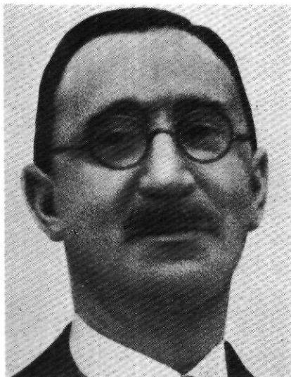
Manuel Serra i Moret: "Catalunya és prou petita per ser administrada sense gaires graons intermedis".