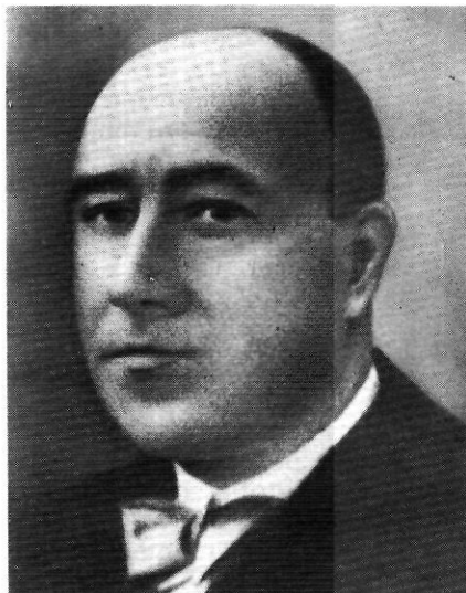
Pau Romeva i Ferrer: "farem una divisió administrativa que no servirà de res".