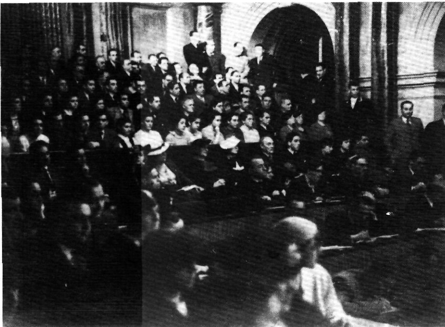
Entre 1932 i 1936, el Parlament de Catalunya va debatre en diverses ocasions el tema de la divisió territorial.