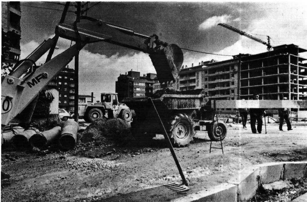
Les demolicions de la Grober descobreixen una Girona inesperada.

bert, hi havien arribat a treballar fins a mil cinc-cents operaris, quan l'empresa fundada per un italià per produir botons, trenyelles, cordons de sabata i articles de merceria monopolitzava la incipient industrialització gironina.