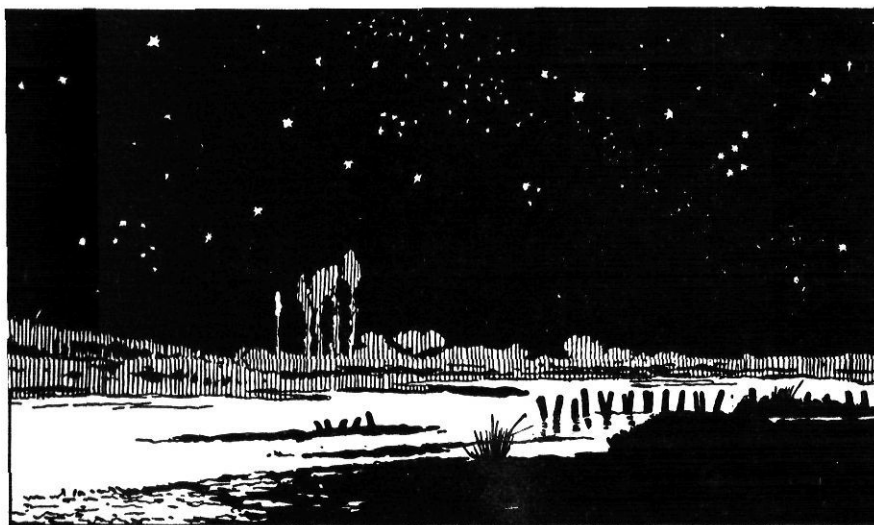
Il·lustracions procedents del «Llibre de la Natura» editat per Seix i Barral l'any 1936.