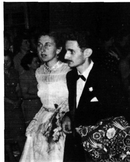
Ai Ball Pla, s'hi llueixen les millors joies, els millors vestits i les millors pells.