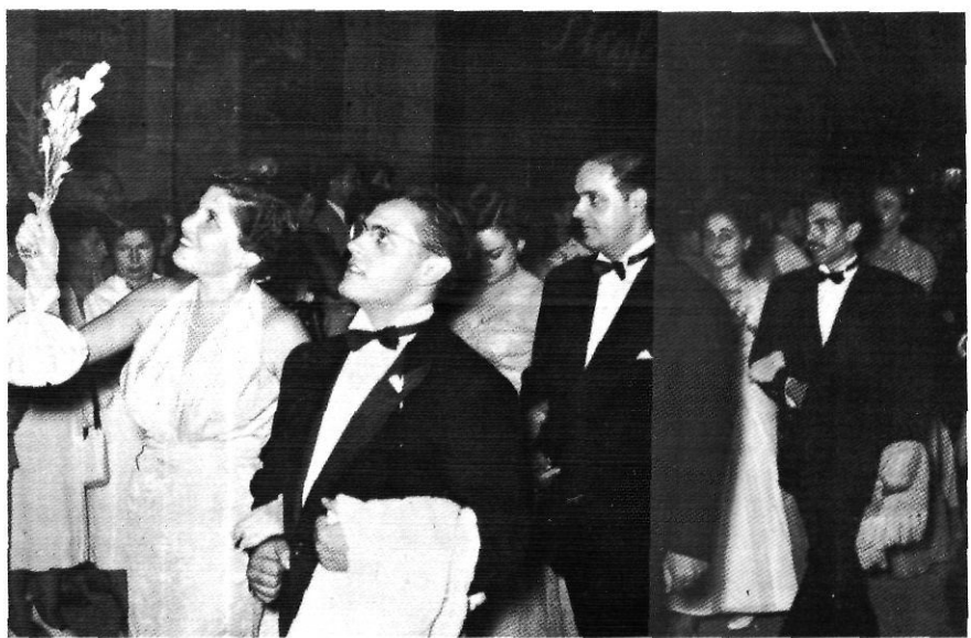
El Ball Pla s'erigeix també en un model de moralització col·lectiva de "tots" els aspectes de la societat.

i Moralicémonos totalitariament, olotenses, ya que nadie tiene