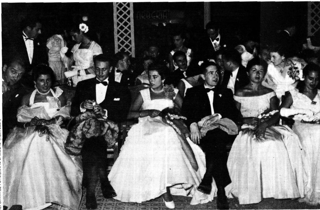
Durant el franquisme, el Ball Pla es converteix en l'acte culminant de la Festa Major, una mena d'essència de les celebracions olotines.