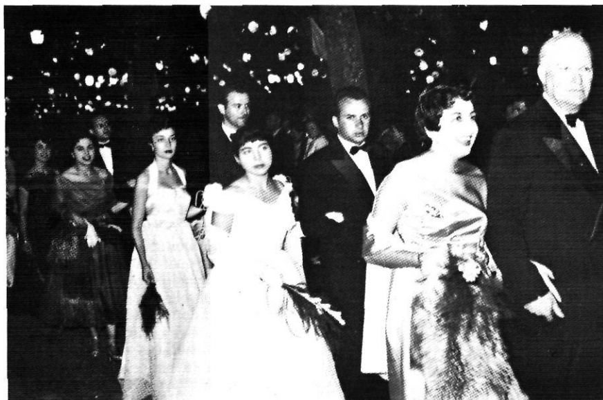
Els participants en el Ball Pla són els que serveixen el poder polític i pertanyen als grups socials més privilegiats.

De l'any 1859, data el primer programa de Festes conegut, i hi figura la nota següent: «A las ocho, iluminada la plaza como en el día 7, se reunirán en el Salón Consistorial el Ayuntamiento y todos los convidados, que con sus respectivas parejas pasarán a recorrer las principales calles adornadas e iluminadas profusamente parándose en la plaza para bailar el Ball Plá».