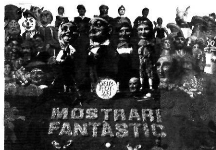
DIVERSOS AUTORS. Mostrari fantàstic. Gegants, caps grossos i bestiar de la Garrotxa. Olot, Edicions Municipals, 1985, s.p.

A mb el subtítol de "Gegants, caps grossos i bestiar de la Garrotxa", s'ha editat, a través d'Edicions Municipals d'Olot, aquest llibre, obra de diferents autors -18 en total-, amb disseny de Kim Domene i fotografies de Josep Ma. Melcior. Per tal de recollir la informació gràfica necessària s'ha recorregut a diferents arxius fotogràfics -25 en total-, i s'ha comptat amb la col·laboració de diversos folkloristes.