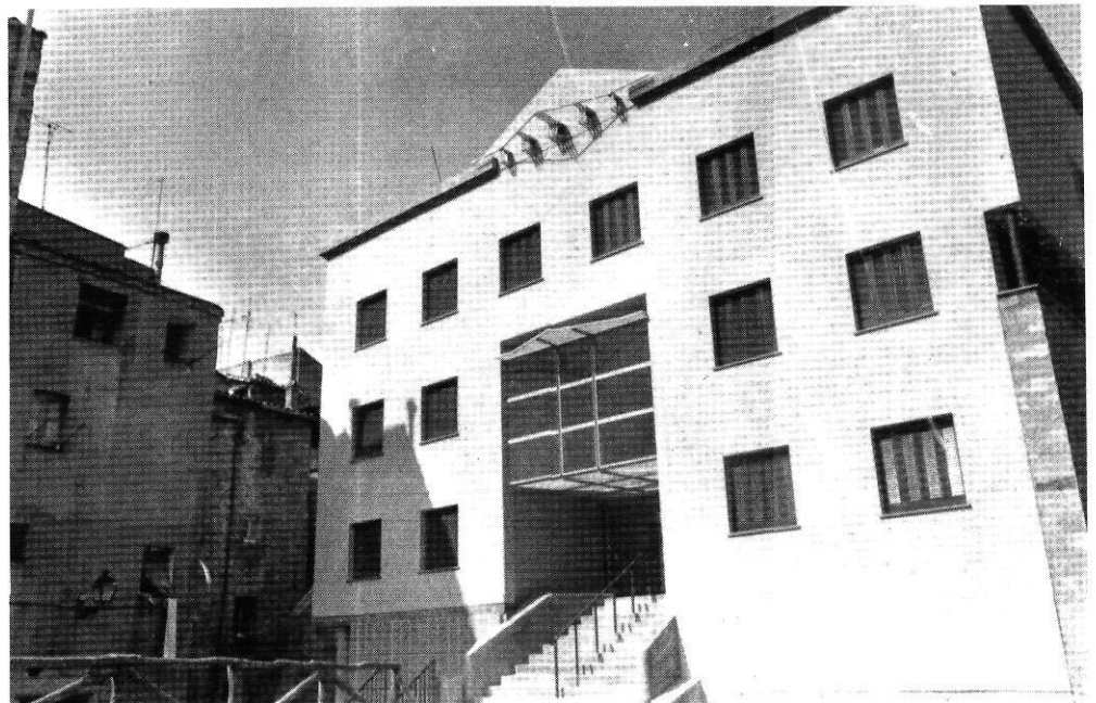
Un immoble difícilment compatible amb l'entorn urbanístic.

Ara, malgrat la democràcia i l'autonomia, sembla que som allà mateix i hem de tornar a pagar els plats trencats. La benvinguda demolició de les cases que hi havia arran del campanar de Sant Feliu ha fet néixer una petita plaça que té, com a teló de fons, un edifici nou. Sobre com havia de ser aquesta casa la Direcció General del Patrimoni Artístic de la Generalitat sostenia uns criteris, però la Direcció General d'Arquitectura i Habitatge, que la feia, en sostenia uns altres. No va haver-hi manera de posar-los d'acord i el resultat ha estat un immoble difícilment compatible amb l'entorn urbanístic, que hom