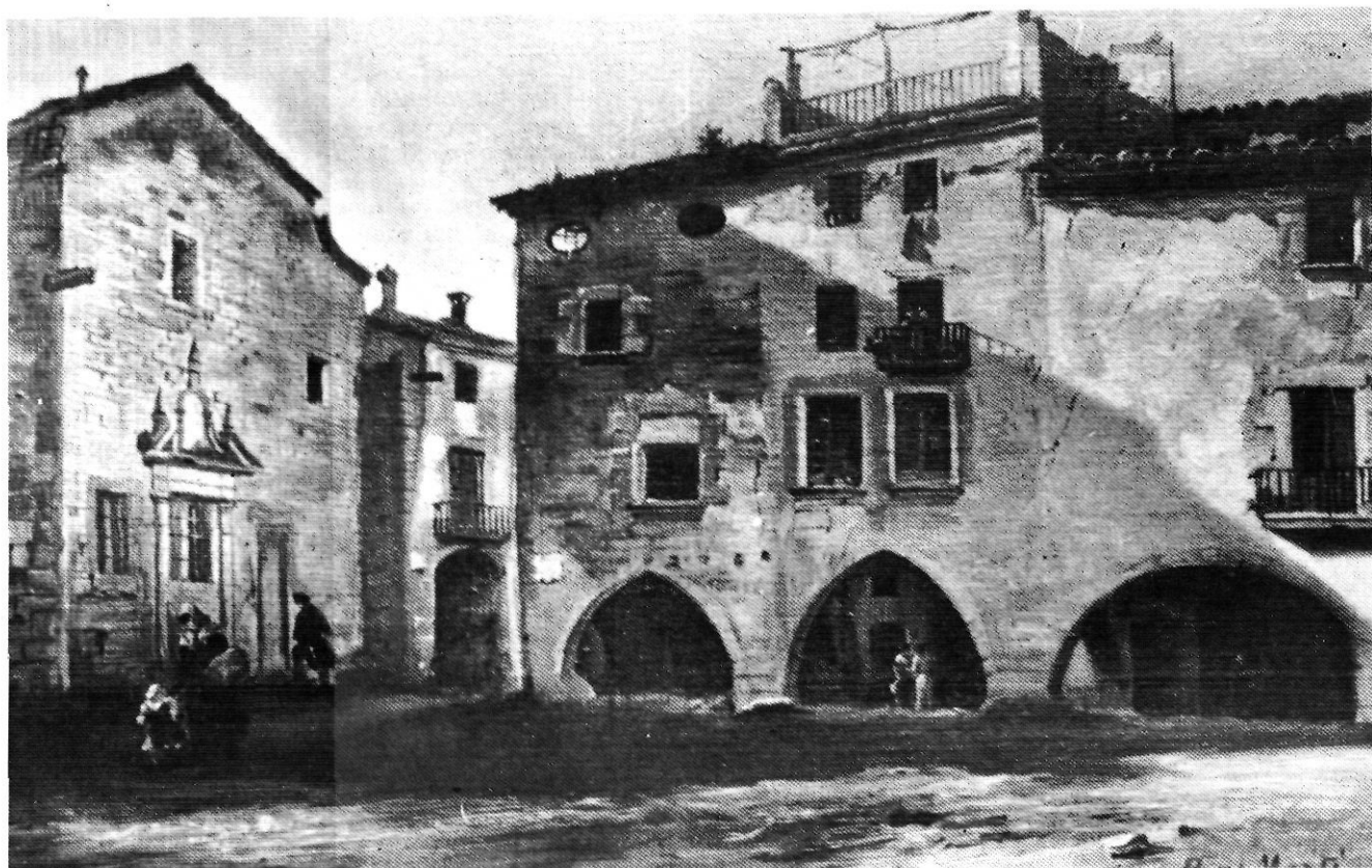
«Plaça i caserna de Sant Francesc», de Jaume Pons Martí