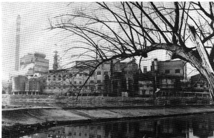
Les fàbriques papereres hauran d'ajustar molt els seus costos per a ser competitives.

En la indústria, l'impacte serà escàs en la construcció. Els sectors tradicionals del metall, tèxtil i paper hauran de patir una forta competència comunitària i, en general, exterior. A Ripoll hi haurà problemàtica del metall força preocupant, amb possibilitats de superació. El tèxtil haurà de defensar-se d'una entrada forta de productes procedents de la CEE i de països tercers, amb unes armes cada cop més pròpies dels països més avançats: disseny, moda, tecnologia, servei comercial, serietat comercial, qualitat, bona gestió. Les fàbriques papereres hauran d'ajustar molt els seus costos per a ser competitives. El mercat paperer coneixerà una forta entrada de papers estrangers. En general, la indústria haurà de fer front al doble impacte del desarmament aranzelari i de l'IVA. L'IVA suposarà menys ajuda a l'empresa exportadora i menys protecció de les importacions. Per la seva banda, la problemàtica del suro seguirà patint del tracte discriminatori que tenim en relació amb Portugal. En aquest sector, s'haurà de fer un esforç notable