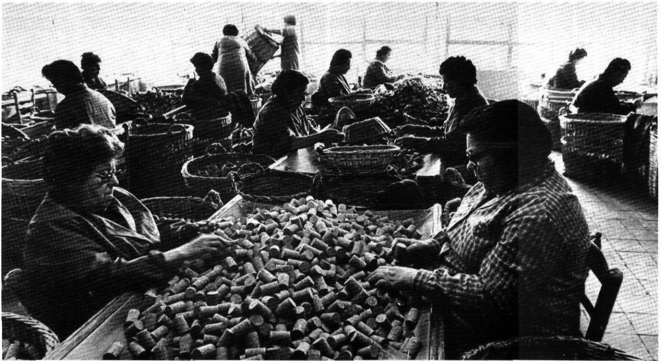
El suro seguirà patint del tracte discriminatori que tenim en relació amb Portugal.