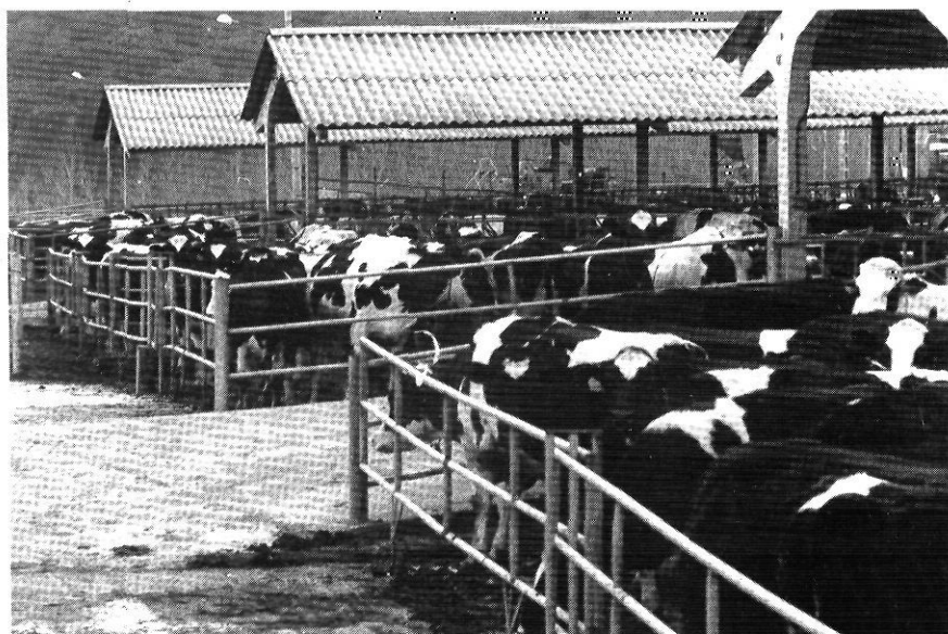
L'impacte de l'adhesió serà estimulant sobre l'agricultura gironina.