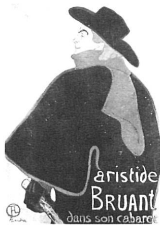
Toulouse-Lautrec a Girona.

propí Palau. Jordi Pujol va acudir a la Fontana d'Or per tal de presidir-lo i reiterar que "Catalunya recupera el seu caràcter carolingi, determinat de la identitat nacional". L'alcalde va insistir en la idea que la integració a Europa és per als gironins, "la reincorporació a les pròpies arrels".