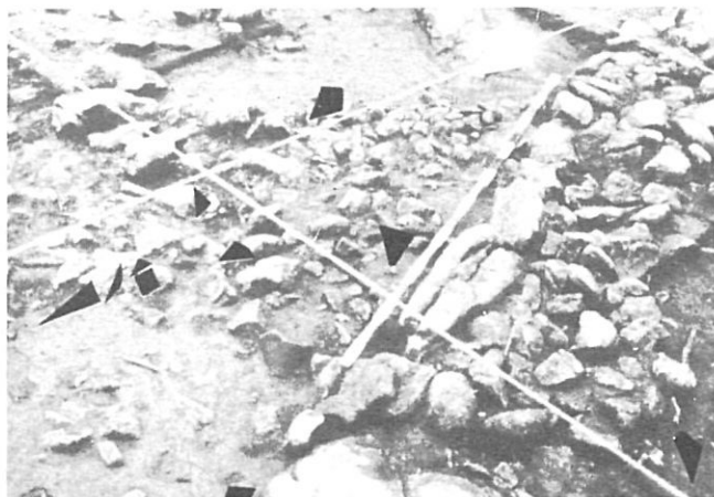
Deu anys de La Fonollera.

A Girona, perquè no es pugui dir que no s'hi fa de tot, s'hi ha celebrat un congrés sobre " Eros i filosofia ", amb la participació de doscents representants de la nova filosofia espanyola, i el Departament de Filologia del Col·legi Universitari ha celebrat el II Certamen Poeticum Linguae Latinae . Els Amics de les Flors han muntat per trentena vegada la