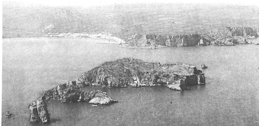
Protecció urgent per a les Medes.