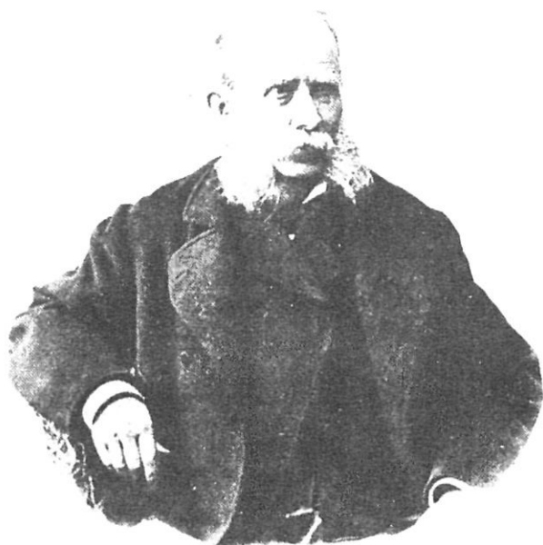
Cent anys de Narcís Monturiol.

gran exposició de cada any, en el marc cada cop més recuperat de Sant Domènec, amb una afluència multitudinària de visitants. La Cambra de Comerç i d'Indústria ha celebrat amb actes protocolaris el seu 75 e aniversari, i ha obtingut permís oficial per ser, a més, de Navegació.