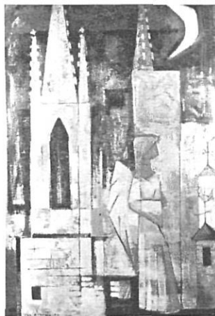
Vila i Fàbrega rehabilitat.