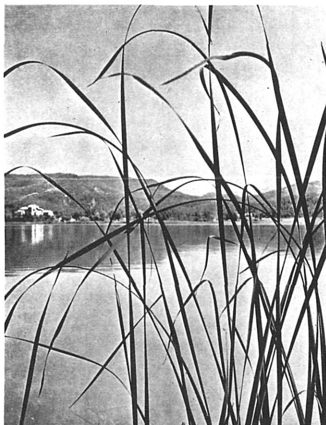
L'Estany de Banyoles: equilibri natural i equilibri psicològic