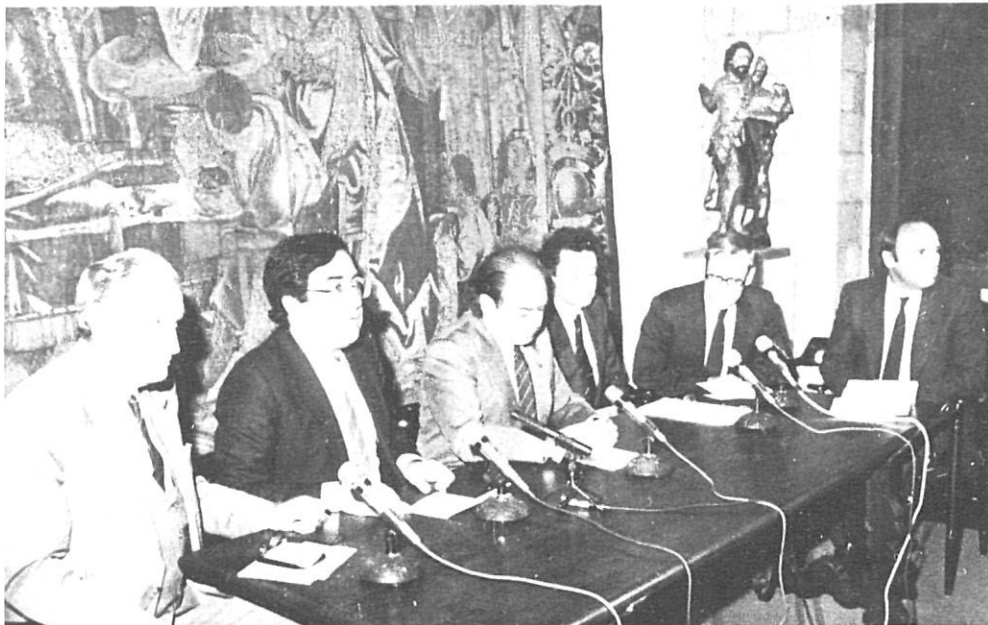
Jordi Pujol presideix el Dia d'Europa a Girona.

El dia 5 de maig, tal com ja s'havia anunciat a Aquisgrà, se celebrava a Girona, excepcionalment, l'acte institucional català del Dia d'Europa que cada any organitza la Generalitat al seu