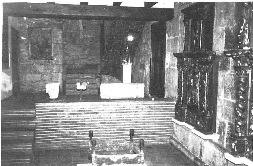
Hi ha un desnivell de rajol sobre el qual s'hi pot veure un relleu romànic de pedra del segle XII.

Davant de l'entrada queda ben urbanitzada la plaça amb arbres i bancs a més de la font. A l'esquerra de la porta, fent quasi angle recte amb la mateixa