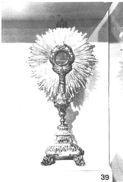
El museu és ric en orfebreria, amb peces com aquesta custòdia de sol.

Davant aquest frontal, a l'esquerra doncs del nostre camí, dins d'una vitrina, es poden veure quatre porres: dues d'elles són gòtiques del s. XV i les altres dues més tardanes. Allò més important i valuós d'aquestes porres, és el fet que són adornades amb boniques peces d'orfebreria, petites estàtutes, que tenen la particularitat que són desmuntables, que no són fixades amb cargols, sinó a pressió. Una talla gòtica del s. XIV representant la Mare de Déu ve a continuació, i després un petit retaule de pintura gòtica també representant escenes de la vida de la Mare de Déu, si bé molt malmès.