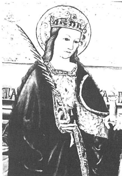
Retaule gòtic amb Santa Caterina.

Fent angle amb la vitrina i a la paret hi ha un Crist tallat en boix, i una tela del s. XVII que representa Santa