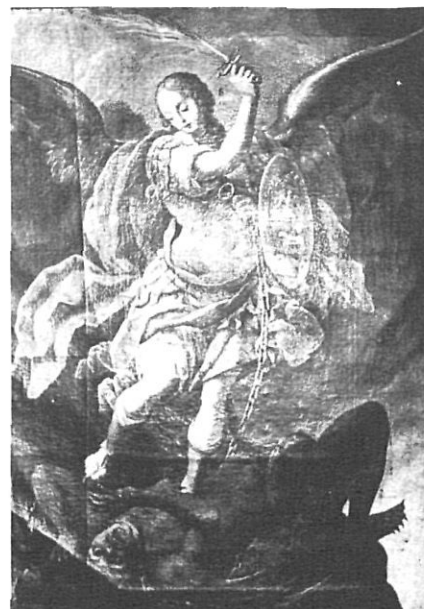
Sant Miquel, tela del segle XVIII.

Magdalena de Pazzis. Després, una creu gòtica de coure i una altra de ferro. Vénen dues vitrines adossades, a la primera de les quals hi ha una creu processional d'argent del s. XIV, i un peu de custòdia o reliquiari. També dos calzes.