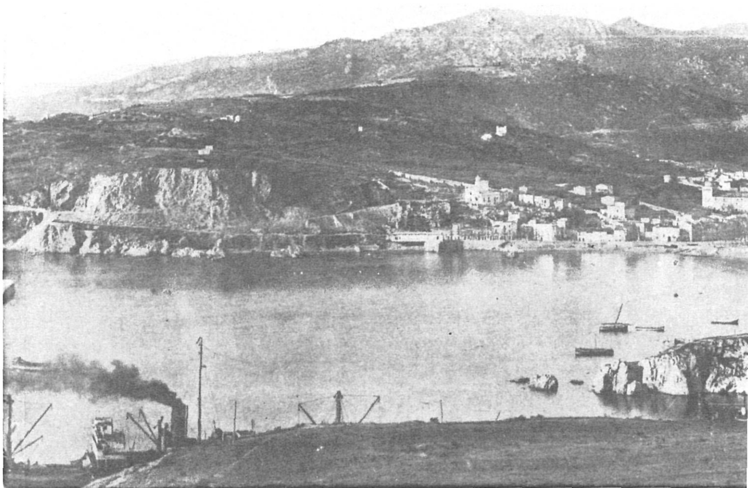
A partir de 1721 desapareixen els senyals de vida de la drassana naval de Sant Feliu.