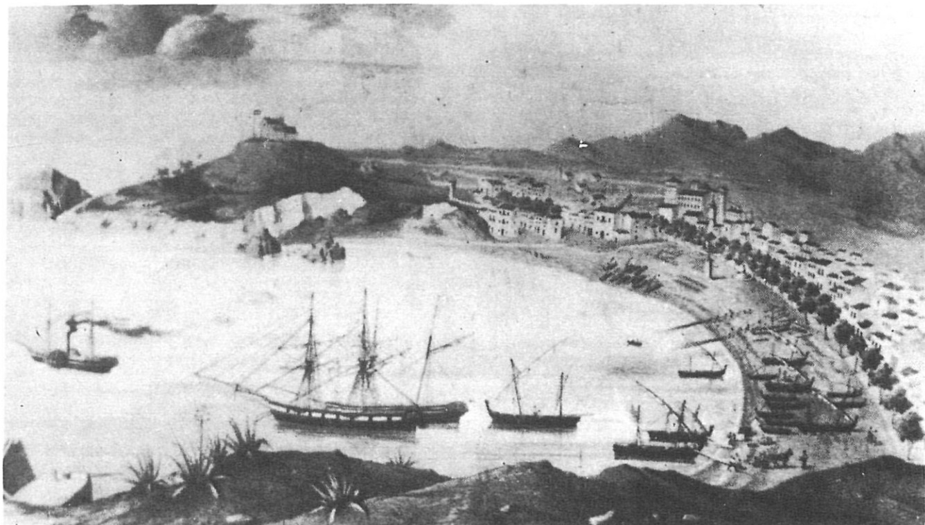
La badia en un dibuix anònim de 1852.