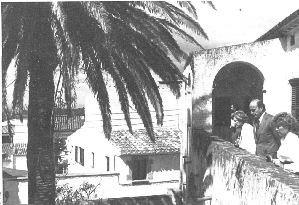
La casa pairal de Pella a Begur, i la torre on treballava.