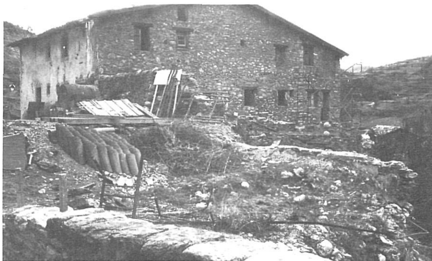
Can Tubert durant el repicat. A l'esquerra, l'estat original.

Arriben els restauradors de "Belles Artes" (inventors de llotges i "noves estils" arquitectònics), i els compradors de casa que vénen de ciutat i volen pedra costi el que costi. A Beget s'introdueix el càncer repicadista, el nou mal de la pedra.