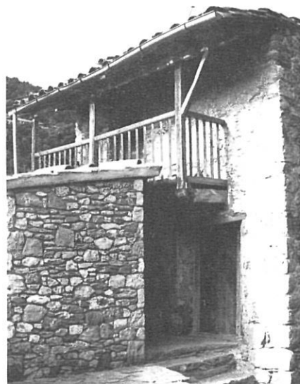
Can Rega: repicat nou i repicat vell.