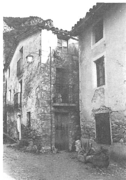
Can Samarrà i Cal Fuster.