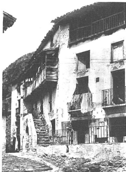
Ca la Menjic, l'any 1918.