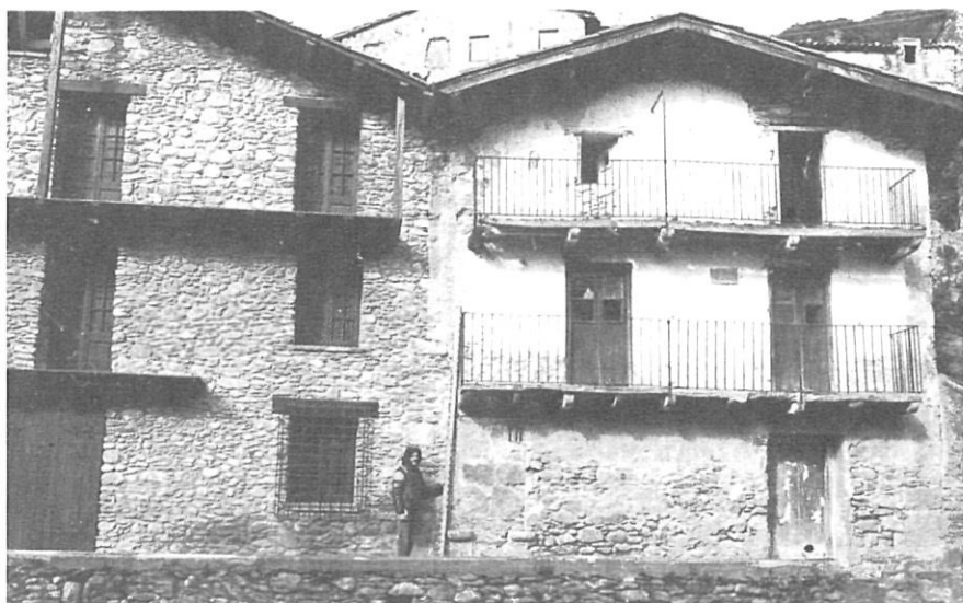
Antic carrer de la Font, o el procés del "repicadisme".