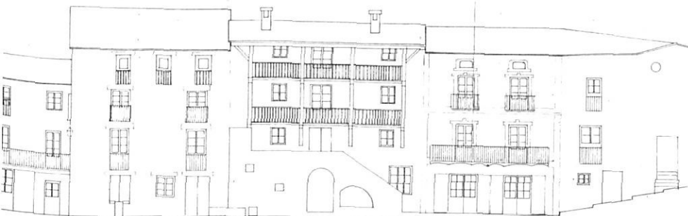
Alçat dels carrers de Bellaire i de França, any 1980.