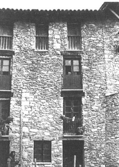
Can Pitús, després del "repicadisme".

ja treballen amb una 3ª façana), ja sia per reconversió d'antics edificis (Can Bes, segurament antiga masia rural construïda damunt d'una altra d'antiquíssima, potser de l'època de la repoblació, es converteix en un "bloc" de pisos per a treballadors (fins a 13 famílies s'hi encabiren; a Can Tubert n'hi viuran 6), o per construcció d'un de nou; ("La Presó" per a Gaspar Soler, ampliació de Can Capdet, etc.).