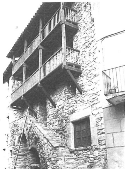
Ca la Menjic, després del "repicadisme".