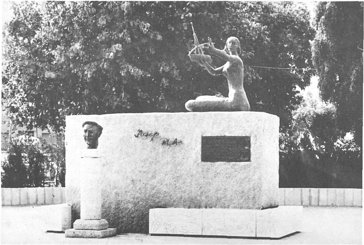
El monument a Josep Pla és voluntàriament antimonumental.