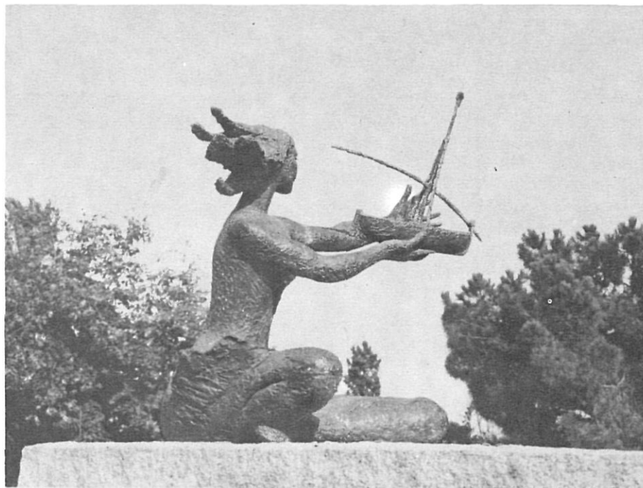
La figura d'una noia en repòs porta a la mà un vaixell amb els pals propis de la vela llatina.