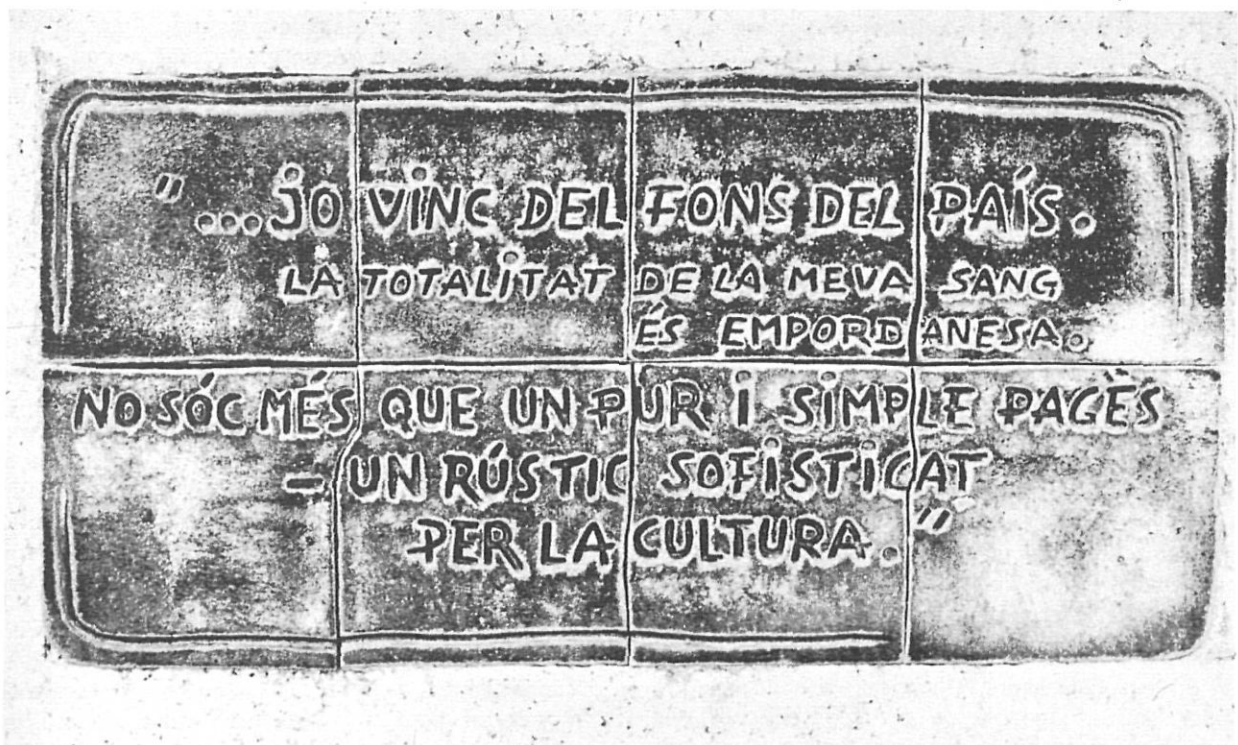
Detall del monument a Josep Pla.