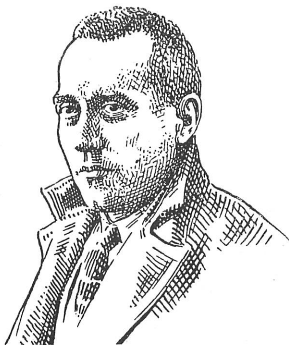
Miquel Santaló, professor de la Normal i capdavanter del republicanisme gironí, arribà a ministre i a primer conseller de la Generalitat.