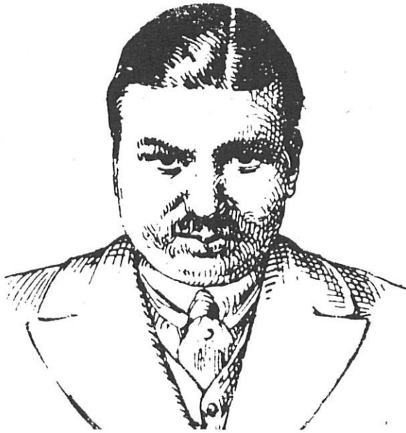
Després de la dimissió de Santaló, Josep M.ª Dalmau esdevingué el segon alcalde del període republicà.

A la fi, el 14 de març, després de tres votacions (13) , l'alcaldia fou confiada a Francesc Tomàs per majoria simple. Per a les finències d'alcaldia hom designà els senyors Bonmatí, Vinyals, Aragó, Cervera i Busom.