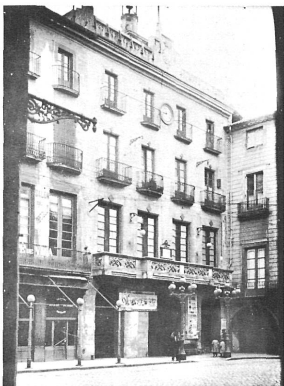
De 1930 a 1936 l'ajuntament de Girona va ser controlat per industrials, comerciants i gent de professions liberals.

s'ordenà el cessament de tots els ajuntaments existents i el nomenament de noves corporacions locals a base d'un sistema que no comportava ni la consulta popular ni la reposició completa dels ajuntaments destituïts pel dictador 2 . La meitat dels càrrecs de conseller era atribuïda als majors contribuents i l'altra meitat als individus que havien assolit majors votacions en les eleccions efectuades des del 1917.