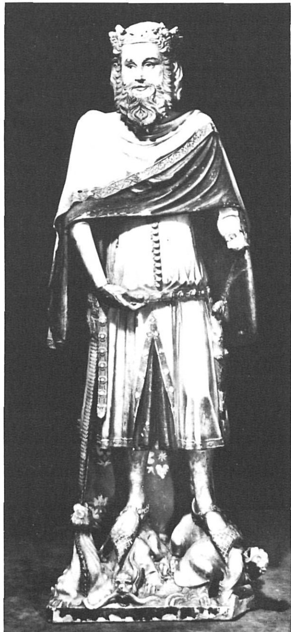
Vers l'any 1385 el rei Pere el Cerimoniós manà a Pere Sacoma de realitzar algunes obres al Palau Episcopal.

Item, té rebatre y enluhir de calç y guig la dita capella y volta de aquella en la part de dins, tot a ses despeses.