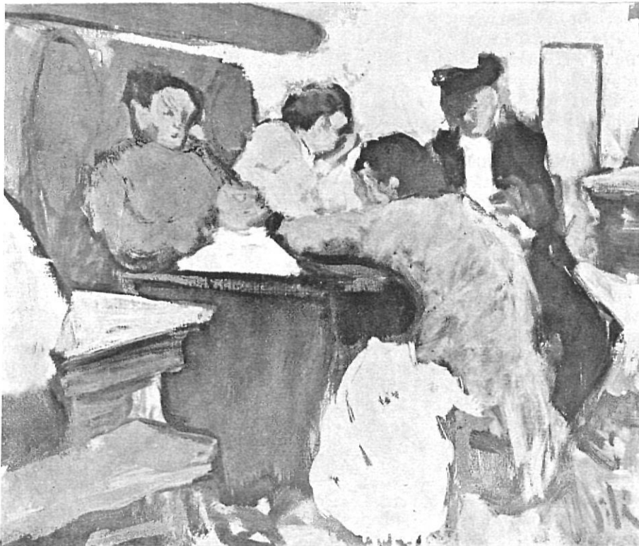
Taverna Museu d'Art Modern (Ceret)

«Quant a la meua opinió envers la nova figuració de l'art conceptual i de l'art abstracte, resumiria dient que és art nou, el qual diré que és necessari com a art d'avantguarda. Hem de recordar que l'art d'en Velázquez va ser així mateix d'avantguarda en el seu temps, i també d'altres en els seus respectius moments;